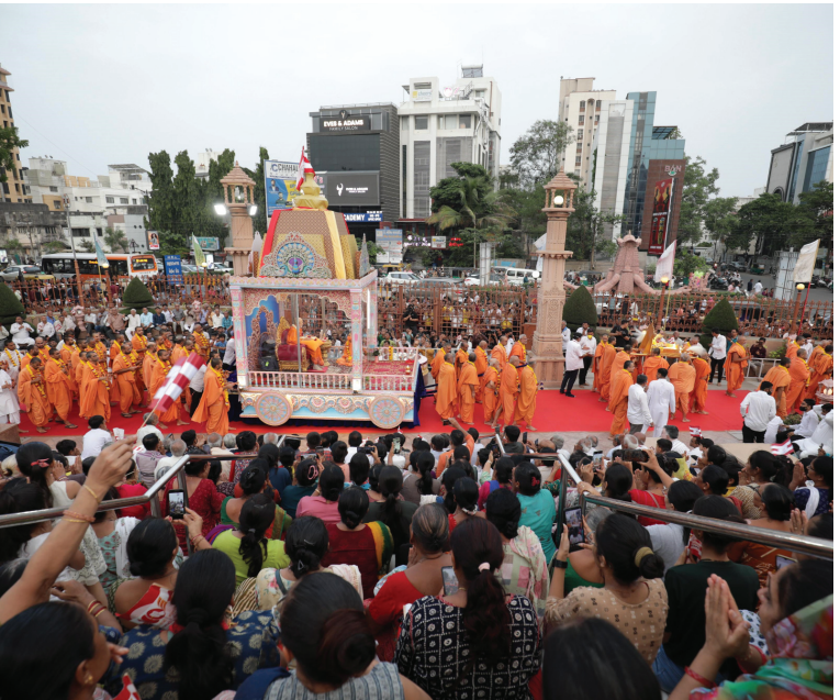
(સૌરાષ્ટ્ર ક્રાંતિ કાર્યાલય)

રથયાત્રા છે, જેને કઈ દિશામાં લઈ જવું એ આપણા હાથમાં છે. આપણા મોટા ભાગ્ય છે કે પ્રગટ ભગવાનની પ્રાપ્તિ થઈ છે. તેઓ આપણા રથના સારથી બન્યા છે અને રથને મોક્ષના માર્ગે ચલાવી રહ્યા છે. જીવનરૂપી યાત્રામાં ગમે તેવા સુખ દુઃખ આવે પણ આપણે રથી એવા ભગવાનને ક્યારેય છોડવા નહિ.' ત્યારબાદ ભારતીય પરંપરાગત વિધિ પ્રમાણે ભગવાનશ્રી જગન્નાથજી અને શ્રી અક્ષરપુરુષોત્તમ મહારાજનું પૂજન કરવામાં આવ્યું,