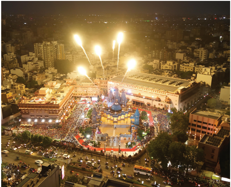
(સૌરાષ્ટ્ર ક્રાંતિ કાર્યાલય)

રાજકોટ ખાતે પ.પૂ.મહંતસ્વામી મહારાજના રોકાણ દરમિયાનની આજની છેલ્લી વિદાય સભા યોજાશે