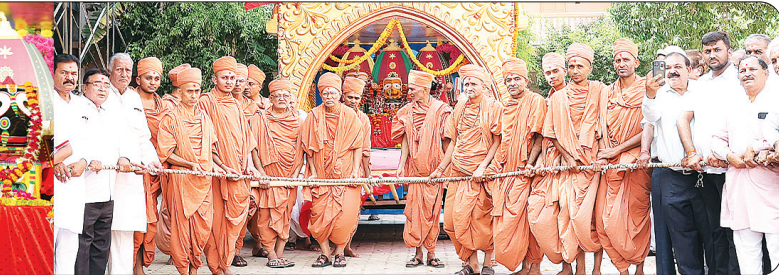
ભક્તો માટે અભિષેક વાહન હશે.જેમાં મહિલા ભક્તો પૂરા રૂટમાં ભગવાનને અભિષેક કરી શકશે. વિરોધ આકર્ષણમાં બાળકો માટેના કાર્ટુન કેરેક્ટરના ગેટ અપમાં કાર્ટુન બાળકોનું મનોરંજન કરશે. મુખ્ય ચોકમાં આરતી ના પોઈન્ટ ઊભા કરવામાં આવેલી છે. જેમાં પેટ્રોલ ડીઝલ કે ધુમાડો કરતાં કોઈ વાહનોનો ઉપયોગ થવાનો નથી.

(સૌરાષ્ટ્ર કાંતિ કાર્યાલય-રાજકોટ) રાજકોટ,તા.૬ આગામી ૭ જુલાઈ રવિવારે સાંજે ૪ વાગ્યે સ્વામિનારાયણ ગુરુકુલ થી ભવ્યાતિ ભવ્ય અને દિવ્યાતિ દિવ્ય રથયાત્રાનો આયોજન થયેલું છે. વર્ષોની પરંપરા અનુસાર ભગવાન જગન્નાથ, સુભદ્રાજી અને બળભદ્રજી ને વિશાળ રથમાં વિરાજીત કરી, સંતો દ્વારા રથને ખેંચીને નગરમાં વિચરણ કરશે. રથયાત્રાના પાવન પર્વે ગુરુદેવ શાસ્ત્રીજી મહારાજની ૧૨૩મી જન્મજયંતી નિમિત્તે દર વર્ષે રથયાત્રાનું આયોજન થાય છે. તેમજ ગુરુકુલ પરિવાર, ધર્મ ઉત્સવ તરીકે મનાવે છે.આ યાત્રામાં સૌથી આગળ ડીજે હશે. ૨૦ ઉપરાંત ઈલેક્ટ્રીક બાઈક સંપૂર્ણ રથયાત્રાનું પાયલોટિંગ કરતા હશે.ત્યારબાદ પદાતી વિદ્યાર્થીઓ અને સાયકલ સવાર યુવાનો અને બાલમંડળના બાળકો