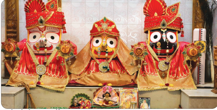
રાજકોટમાં શ્રી જગન્નાથ મંદિર-કૈલાસધામ આશ્રમ તથા ઈસ્કોન મંદિર દ્વારા રથયાત્રાનું આયોજન

રાજકોટ, તા.૬ આવતીકાલે અષાઢી બીજનો પરમ પુણ્યવંતો દિવસ છે. જગન્નાથપુરીમાં ભગવાન જગન્નાથ,