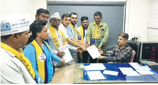
(સોરઠ્ઠ ક્રાંતિ કાર્યાલય-રાજકોટ) રાજકોટ જિલ્લા-શહેર આમ આદમી પાર્ટી દ્વારા રાજકોટ કલેક્ટર મારફત મુખ્યમંત્રીને આવેદનપત્ર પાઠવ્યું છે. આવેદનપત્રમાં જણાવ્યું છે કે, સરકાર દ્વારા ગુજરાતની સામાન્ય જનતાની સ્વાસ્થ્ય ક્ષેત્રે સેવા કરવાના હેતુ સહ સ્વનિર્ભર તબીબી કોલેજો ખોલવામાં આવેલી છે પરંતુ તાજેતરમાં એટલે કે ૨૮-જૂન-૨૦૨૪ ના રોજ ગુજરાત

જિલ્લા-શહેર આમ આદમી પાર્ટી દ્વારા રાજકોટ કલેક્ટર મારફત મુખ્યમંત્રીને કરાઈ રજૂઆત