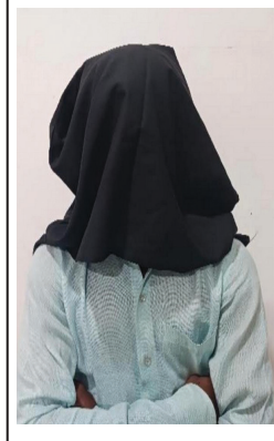
(સૌરાષ્ટ્ર ક્રાંતિ કાર્યાલય) રાજકોટ તા.૬ કોઠારીયા રોડ ગોવિંદનગરમાં તથા એક મોબાઈલ ફોન કી પેડ વાળો કબ્જે કર્યા છે.