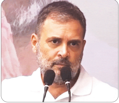
અમદાવાદ, તા.૬ આજે રાહુલ ગાંધી ગુજરાતના મુલાકાતે આવ્યા છે. અહીં તેઓ રાજકોટ અંકિશંકા, વડોદરા બોટકાંડ