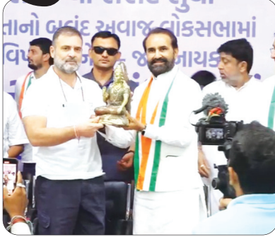
અમદાવાદ, તા.૬ આજે રાહુલ ગાંધી ગુજરાતના મુલાકાતે આવ્યા છે. અહીં તેઓ રાજકોટ અંકિશંકા, વડોદરા બોટકાંડ