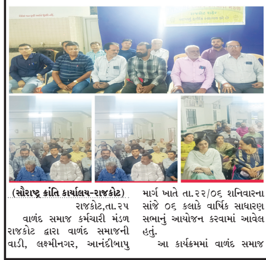
(સૌરાષ્ટ્ર ક્રાંતિ કાર્યાલય-રાજકોટ) માર્ગ ખાતે તા.૨૨/૦૬ શનિવારના રોજ રાજકોટ,તા.૨૫ વાળંદ સમાજ કર્મચારી મંડળ રાજકોટ દ્વારા વાળંદ સમાજની વાર્ષિક સાધારણ સભા યોજાઈ હતી. આ કાર્યક્રમમાં વાળંદ સમાજ