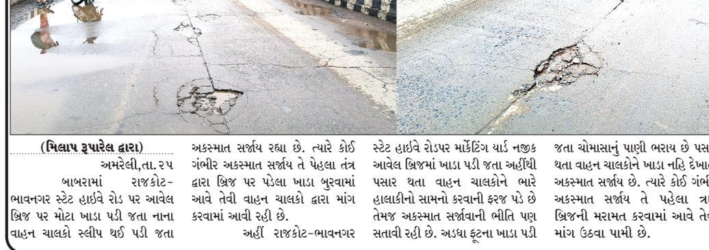
(ખિલાપ રૂપરેલ દ્વારા) અમરેલી,તા.૨૫ બાબરામાં રાજકોટ-ભાવનગર સ્ટેટ હાઈવે રોડ પર આવેલ ખિજા પર મોટા ખાડા પડી જતા નાના વાહન ચાલકો સ્લીપ થઈ પડી જતા અકસ્માત સર્જાય તે પહેલા તંત્ર દ્વારા ખિજા પર પુલના ખાડા બુરવામાં આવે તેવી વાહન ચાલકો દ્વારા માંગ કરવામાં આવી રહી છે. અહીં રાજકોટ-ભાવનગર સ્ટેટ હાઈવે રોડ પર માર્કેટિંગ વાઈ નહીં આવેલ ખિજામાં ખાડા પડી જતા અહીંથી પસાર થતા વાહન ચાલકોને ભારે હાલાકીનો સામનો કરવાની ફરજ પડે છે તેમજ અકસ્માત સર્જવાની ભીતિ પણ સતવાઈ રહી છે. અડધા ફૂટના ખાડા પડી જતા ચોમોસાનું પાણી ભરાય છે પસાર થતા વાહન ચાલકોને ખાડા નહિ દેખાતા અકસ્માત સર્જાય છે. ત્યારે કોઈ ગંભીર અકસ્માત સર્જાય તે પહેલા ત્રણ ખિજાની મરામત કરવામાં આવે તેવી માંગ ઉઠવા પામી છે.