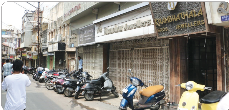
બંધમાં જોડાનાર તમામ વેપારી અને વેપારી એસોસિએશનો