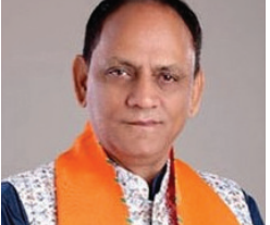
(સૌરાષ્ટ્ર ક્રાંતિ કાર્યાલય)