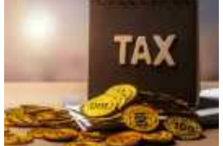
(એજન્સી સમાચાર) બેંગ્લોર, તા.૧૯ જીએસટી વળતર યોજના કેન્દ્ર સરકારે બંધ કરી દઈ રાજ્યોને વેરાની

૧૪ ટકા જીએસટી વૃદ્ધિદર પ્રાપ્ત નહીં થાય: રિઝર્વ બેંકનો ચોંકાવનારો અહેવાલ પાશ્વર્ય વળતર ચૂકવવાનું બંધ કર્યું છે. જેના પરિણામે ગુજરાત સહિત દેશના ૧૦ થી વધુ રાજ્યો માટે ગંભીર આર્થિક સંકટ ઉભું થાય તેવી શક્યતા છે. રિઝર્વ બેંકના એક અહેવાલમાં એવી લાલબતી ધરવામાં આવી છે કે, ગુજરાત જેવા રાજ્યોના જીએસટી કલેક્શનમાં મોટું ગાબડું પડી શકે છે અને ૧૪ ટકા જીએસટી વૃદ્ધિદર હાંસલ કરી શકાશે નહીં. આ રીપોર્ટ ગુજરાત માટે ચોંકાવનારો છે.