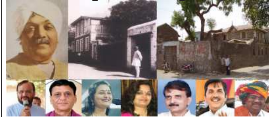
વાયકોએ નોંધ લેવી કે કોઈપણ બહેર ખબરમાં જણાવેલી માહિતીની સત્યતા બાબતે અમો કોઈ બાહેધરી આપતા નથી. વાયકોએ પોતાની રીતે પુસ્તી ચકાસણી કરીને યોગ્ય નિર્ણય લેવાનો રહેશે. વ્યવસ્થાપક: સૌરાષ્ટ્ર ક્રાંતિ