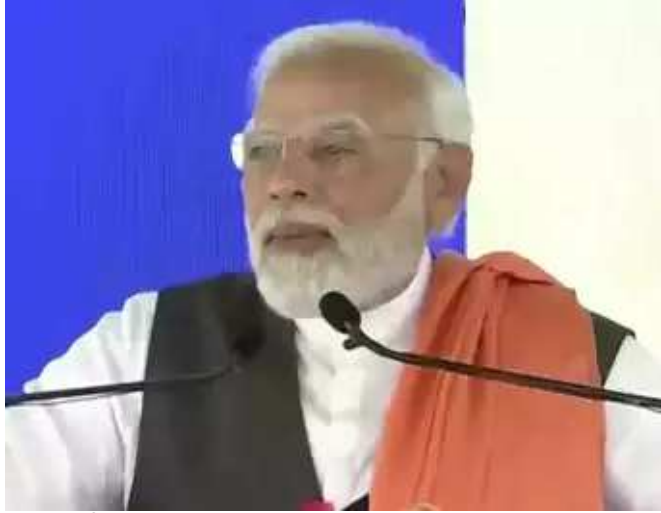
(એજન્સી સમાચાર) ભારતવર્ષક બજાવ્યું હતું કે, અમારી નવી દિલ્હી, તા.૧૯ સરકાર વોટબેંકના રાજકારણ માટે વડાપ્રધાન નરેન્દ્ર મોદીએ આજે નહીં પણ વિકાસ માટેની સરકાર છે.