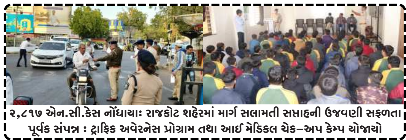
૨,૮૧૭ એન.સી.કેસ નોંધાયા: રાજકોટ શહેરમાં માર્ગ સલામતી સમાહની ઉજવણી સફળતા પૂર્વક સંપન્ન : ટ્રાફિક અવેરનેસ પ્રોગ્રામ તથા આઈ મેડિકલ ચેક-અપ કેમ્પ યોજાયો

(સૌરાષ્ટ્ર ક્રાંતિ કાર્યાલય-રાજકોટ) રાજકોટ, તા.૧૯ રાજકોટ શહેર ટ્રાફિક પોલીસ દ્વારા ગત તા. ૧૧ બન્યુઆરીથી ૧૭ બન્યુઆરી સુધી ૩૩ માં 'માર્ગ સલામતી સમાહ'ની ઉજવણી કરવામાં આવી હતી. જે અન્યથે માર્ગ પર થતા અકસ્માતોના બનાવો નિવારવા અને વાહન ચાલકોને વાહન ચલાવતી વખતે રાખવાની સુરક્ષા અને જાગૃત કરવા જરૂરી માર્ગદર્શન આપવામાં આવ્યું હતું.