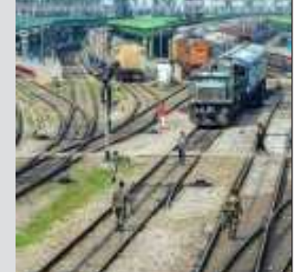
(એજન્સી સમાચાર) નવી દિલ્હી, તા.૧૯ આગામી વર્ષના બજેટમાં હવે ગણતરીના દિવસો જ બાકી છે. નાણામંત્રી નિર્મલા સિતારમણ ૧ ફેબ્રુઆરીએ બજેટ રજૂ કરશે. આવનારા બજેટમાં ભારતીય રેલવે માટે ઘણી મોટી બહેરાતો કરવામાં આવી શકે છે. અંગ્રેજી અખબાર ટાઈમ્સ ઓફ ઈન્ડિયાના અહેવાલ મુજબ, આગામી બજેટમાં રેલવે દ્વારા ૩૫ હાઈડ્રોજન ઈંધણવાળી ટ્રેનો, ૪૦૦-૫૦૦ વંદેભારત ટ્રેનો, લગભગ ૪,૦૦૦ નવી ડિઝાઇનવાળા ઓટોમોબાઇલ કેરિયર કોચ અને લગભગ ૫૮,૦૦૦ વેગનનો સમાવેશ કરવાની યોજના છે. બહેરાત કરી શકાય છે. આ તમામને આગામી ત્રણ વર્ષમાં પાટા પર મૂકી શકાય છે.

રિપોર્ટમાં સૂચના હવાલાથી કહેવામાં આવ્યું છે કે બજેટમાં ભારતીય રેલવેને ૧.૯ લાખ કરોડ રૂપિયા ફંડ તરફ આપવામાં આવી શકે છે. આ દ્વારા, ભારત સરકાર ૨૦૩૦ સુધીમાં તેના રોલિંગ સ્ટોક (ટ્રેન, કોચ અને વેગનના આધુનિકીકરણ), રેલવે ટ્રેકના સુધારણા અને વિદ્યુતીકરણ અને યોજના શુભ્ય કાર્બન ઉત્સર્જનનું વલ્ક્ય હાંસલ કરવા માંગે છે.