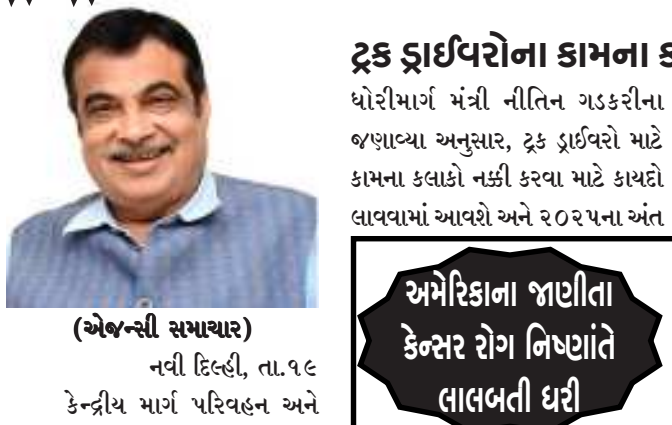
(એજન્સી સમાચાર) નવી દિલ્હી, તા.૧૯ કેન્દ્રીય માર્ગ પરિવહન અને