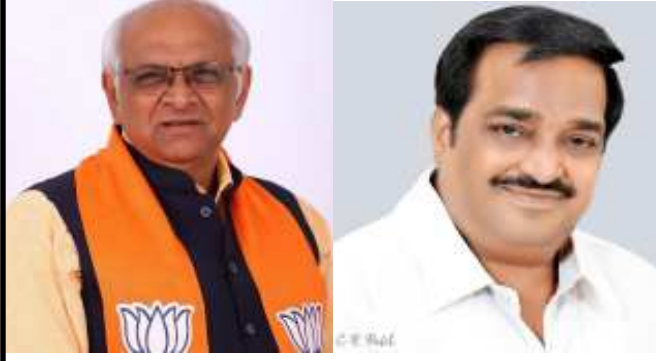
રાજકોટ, તા.૧૮ આગામી તા.૨૩ અને ૨૪ સોમ-મંગળવારે પ્રદેશ ભાજપની કારોબારી સુરેન્દ્રનગર ખાતે યોજાનાર છે. આ કારોબારીમાં મુખ્યમંત્રી ભુપેન્દ્રભાઈ પટેલ, પ્રદેશ પ્રમુખ પાટીલની ઉપસ્થિતિમાં ભાજપના દિગ્ગજ નેતાઓ મહામંથન કરનાર હોવાનું જાણવા મળેલ છે.

પૂર્વ તૈયારીઓ માટે સૂરસાગર ડેરી ખાતે બેઠક મળી હતી આ કારોબારી બેઠકમાં ૬૫૦ થી વધુ નેતાઓ ઝાલાવાડના મહેમાન બનનાર હોવાનું જાણવા મળેલ છે. ભાજપની પ્રદેશ કારોબારી