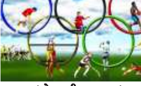
(એન-સી સમાચાર) ગાંધીનગર, તા.૧૮ ઓલિમ્પિકના યજમાન બનવા માટે મજબુત દાવો રજૂ કરવા ગુજરાત સરકાર સજ્જ થઈ ગઈ છે. ૨૦૩૬ નો ઓલિમ્પિક મેળાવડો યોજવાનું બહુમાન ગુજરાતને પ્રાપ્ત થાય એ માટે અત્યારથી બેરદાર

તૈયારીઓ શરૂ કરી દેવામાં આવી છે. ખાસ આંતરરાષ્ટ્રીય કક્ષાનું એથલેટ ઓલિમ્પિક વિલેજ ૫૦૦ એકર જમીન પર સાકાર થશે. એ માટે જમીન ફાળવણીની પ્રક્રિયા શરૂ કરી દેવામાં આવી છે. રમતવીરો અને સ્પોર્ટિંગ સ્ટાફ માટે એથલેટ વિલેજમાં તમામ અતિઆધુનિક સાધન સુવિધાઓ રાખવામાં આવશે. રાજ્ય સરકારના સૂત્રોએ જણાવ્યા મુજબ ઓલિમ્પિકની રમતો માટે સરદાર પટેલ સ્પોર્ટ્સ