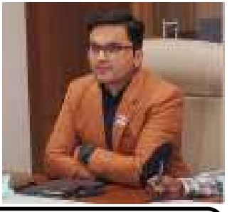
(અનુ.પાના નં.૪ ઉપર)

સભ્યો સામાન્ય સભામાં આવા અધિકારીને સરકારમાં પરત મોકલવાનો ઠરાવ બહુમતીથી અથવા તો સર્વાનુમતે કરતા હોય છે. પરંતુ