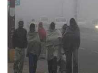
(એન-સી સમાચાર) નવી દિલ્હી, તા.૧૮ ઉત્તર ભારત અને રાજધાની દિલ્હી સતત ઠંડીની લપેટમાં છે.

ભારતીય હવામાન વિભાગ અનુસાર ૨૧ થી ૨૫ બન્યુઆરીની વચ્ચે એક સક્રિય વેસ્ટર્ન ડિસ્ટર્બન્સ ઉત્તર-પશ્ચિમ ભારતને અસર કરે તેવી શક્યતા છે. જેના કારણે પશ્ચિમ હિમાલય વિસ્તારમાં ૨૧મીએ વહેલી સવારે વરસાદ અને હિમવર્ષાની પ્રક્રિયા ચાલુ રહેશે. ૨૩ અને ૨૫ બન્યુઆરી સુધીમાં તે વધુ તીવ્ર થવાની ધારણા છે. હવામાન વિભાગે અનેક રાજ્યોમાં રેડ એલર્ટ બહેર કર્યું છે. દેશમાં સતત વધી રહેલી ઠંડી વચ્ચે ૨૩ અને ૨૫ બન્યુઆરીએ પંજાબ, હરિયાણા, ઉત્તર પ્રદેશ અને ઉત્તર રાજસ્થાન સહિત ઉત્તર-પશ્ચિમ ભારતના મેદાની વિસ્તારોમાં વરસાદની સંભાવના છે. આ સાથે ૫૦ કિમી પ્રતિ કલાકની ઝડપે ફૂંકાતા ઠંડા પવનોને કારણે લોકોની મુશ્કેલીમાં વધારો થશે. બેકે આનાથી લોકોને પ્રદૂષણ અને સૂકી ઠંડીથી રાહત મળશે. (અનુ.પાના નં.૪ ઉપર)