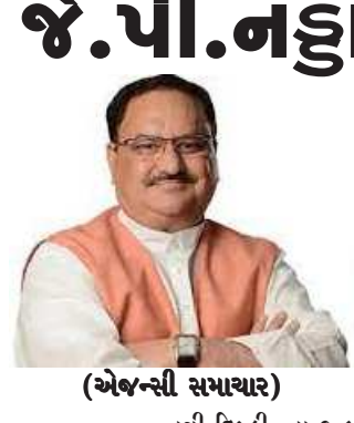
(એજન્સી સમાચાર) નવી દિલ્હી, તા.૧૮

મારા જેવો સામાન્ય કાર્યકર રાષ્ટ્રીય પ્રમુખ બને એ માત્ર ભાજપમાં જ શક્ય બને: નહાનું લાગણીભર્યું ટ્વીટ ભાજપના રાષ્ટ્રીય અધ્યક્ષ તરીકે જે.પી. નહાનો કાર્યકાળ જૂન-૨૦૨૪ સુધી લંબાવવાનો નિર્ણય લેવામાં આવ્યો છે. આભારવશ નહાએ ટ્વીટ મારફત પોતાની લાગણીઓ વ્યક્ત કરતા ઉપકરવશ જણાવ્યું હતું કે, મારા જેવો એક સામાન્ય અને સાદો કાર્યકર રાષ્ટ્રીય પ્રમુખ બને એ માત્ર ભાજપમાં જ શક્ય બને. નહાએ લોકસભાની ચૂંટણીઓ પહેલા પોતાના શિરે મુકવામાં આવેલી મોટી જવાબદારી અંગે જણાવ્યું હતું કે, મારા પર બહુ મોટી જવાબદારી મુકવામાં આવી છે. તેનો મને અહેસાસ છે. મારી પાસે ઘણીબધી અપેક્ષાઓ રાખવામાં આવી છે એ વિશે હું પુરેપુરો સચેત છું. મહાન આગેવાનોએ જેનું નેતૃત્વ કર્યું એવી ચળવળને આગળ ચલાવવાની જવાબદારી હાંસલ થાય એ