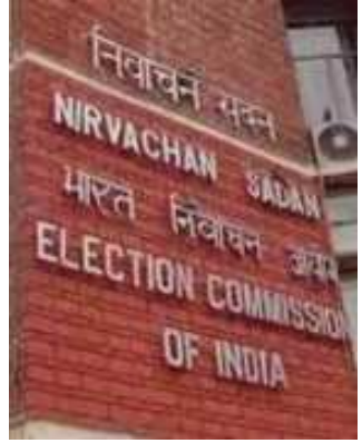
(એન-સી સમાચાર) નવી દિલ્હી, તા.૧૮ ઈશાન ભારતના ૩ રાજ્યો