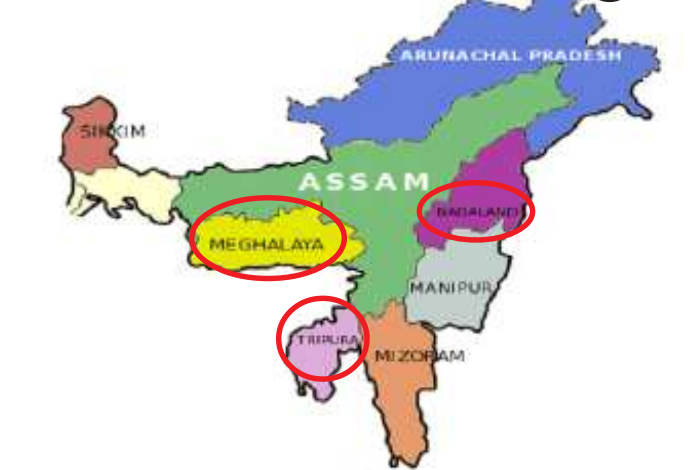
રાજ્યોમાં કુલ ૨.૨૮ લાખ નવા મતદારો નોંધાયા છે. (૨.૧૨)

સંચાલન માત્ર મહિલા કર્મચારીઓ કરશે. મુખ્ય ચૂંટણી કમિશનરે ઉમેર્યું હતું કે, મતદાનની તારીખ પહેલા જેમની વય ૧૮ વર્ષ થઈ જાય એવા યુવાનોને વેલકમ કીટ આપવામાં આવશે. આવા ૧૦ હજાર યુવાનોના નામની નોંધણી થઈ ગઈ છે. ૩