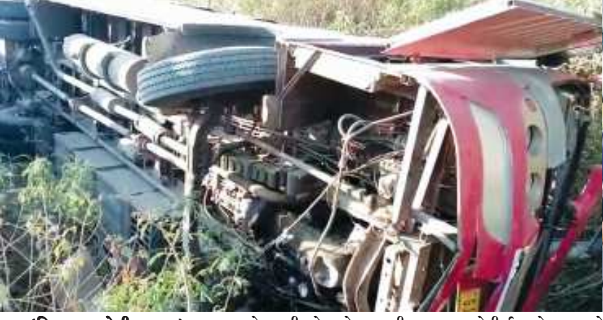
(બિલાપ રૂપારેલીયા દ્વારા) ગામે આવી રહેલ એક બસની બસના અમરેલી, તા.૧૮ રાજકોટ ગામેથી અમરેલી ઉપરનો કાબુ ગુમાવી દેતા બસમાં બેઠેલા ૨૧ થી પણ વધુ લોકોને નાની

મોટી ઈજાઓ થવા પામેલ છે. જેમાંથી કેટલાક લોકોને ગંભીર ઈજાઓ થતાં અમરેલીના સરકારી દવાખાને ખસેડવામાં આવ્યા છે. આ બનાવની