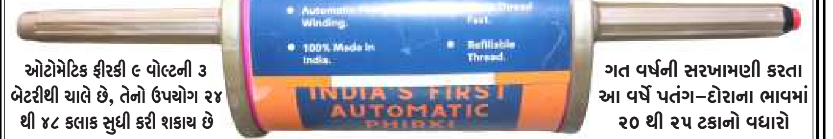
ઓટોમેટિક ફીરકી ૬ વોલ્ટની ૩ બેટરીથી ચાલે છે, તેનો ઉપયોગ ૨૪ થી ૪૮ કલાક સુધી કરી શકાય છે

'સૌરાષ્ટ્ર ક્રાંતિ'ની ટીમ સાથે વાતચીત દરમિયાન વેપારીએ જણાવ્યું હતું કે, ગત વર્ષની સરખામણીએ આ વર્ષે પતંગ-દોરીના ભાવમાં ૨૦ થી ૨૫ ટકાનો ભાવ વધારો બેવા મળ્યો છે. વધુમાં જણાવ્યું હતું કે, હાલની બજારમાં ઓટોમેટિક ફીરકી આકર્ષણનું કેન્દ્ર બની છે. આ ઓટોમેટિક ફીરકી ૬ વોલ્ટની ૩ બેટરીથી ચાલે છે. તેનો ઉપયોગ ૨૪ થી ૪૮ કલાક સુધી કરી શકાય છે. ત્યારબાદ બેટરીને ચાર્જ કરવી પડે છે. તેમજ તેમાં દોરો પણ બદલાવી ઓટોમેટિક ફીરકી હાલની બજારમાં સૌથી ભારેમાં ભારે હતું કે, સાદી પ્લાસ્ટિકની પતંગની કિંમતમાં ૨૦ રૂપિયાથી મળે છે. ગત વર્ષની સરખામણી કરતા આ વર્ષે પતંગ-કિંમત રૂ.૧૦ થી શરૂ કરીને ૨૦૦૦ સુધીની ફીરકી