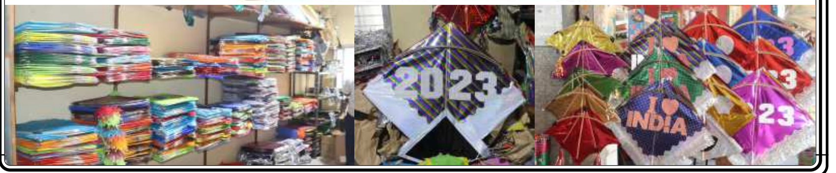
ગત વર્ષની સરખામણી કરતા આ વર્ષે પતંગ-દોરીના ભાવમાં ૨૦ થી ૨૫ ટકાનો વધારો