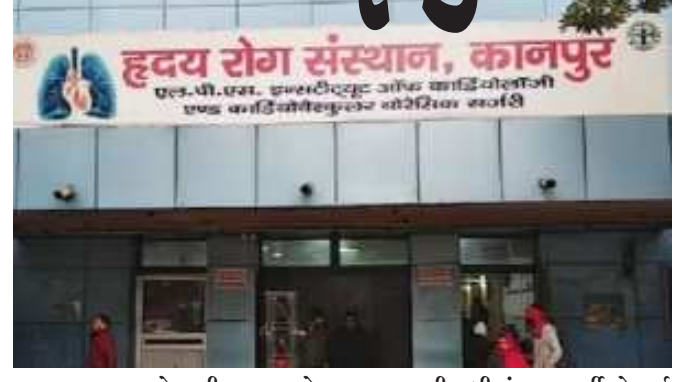
ખાસ કાળજી લેવાની જરૂર છે. બન્યુઆરી સુધીમાં ૧૦૮ દર્દીઓ હાર્ટ કાર્ડિયોલોજી મેનેજરના આંકડા મુજબ ૧ બન્યુઆરી, ૨૦૨૩થી ૮ એટેકને કારણે મૃત્યુ (અનુ.પાના નં.૪ ઉપર)

(એજન્સી સમાચાર) કાનપુર, તા.૧૦ યુપીના કાનપુરમાં ઠંડીનું જોર ચાલુ છે. લઘુત્તમ તાપમાન બે ડિગ્રીએ પહોંચી ગયું છે. આવી સ્થિતિમાં વધતી જતી ઠંડીના કારણે લોકો બીમાર પડી રહ્યા છે. આ કડકડતી ઠંડીમાં હાર્ટ એટેકના દર્દીઓને ભારે હાલાકીનો સામનો કરવો પડી રહ્યો છે. સ્થિતિ એવી છે કે લોકો હાર્ટ એટેકના કારણે મૃત્યુ પામી રહ્યા છે. કાનપુરની હાર્ટ ડિસીઝ ઈન્સ્ટિટ્યૂટના આંકડા પણ એ દર્શાવે છે કે શહેરમાં હૃદયરોગના દર્દીઓ સતત મૃત્યુ પામી રહ્યા છે. રોજના ૬૦૦થી વધુ દર્દીઓ ઓપીડીમાં પહોંચી રહ્યા છે. હૃદયરોગ સંસ્થામાં ૫૦૦થી વધુ દર્દીઓની સારવાર ચાલી રહી છે. છેલ્લા એક અઠવાડિયામાં હાર્ટ એટેકના કારણે ૧૦૮ના મોત થયા છે. તમને જણાવી દઈએ કે, હાર્ટ એટેકથી થયેલા મૃત્યુના આંકડા કાનપુર હાર્ટ ડિસીઝ ઈન્સ્ટિટ્યૂટમાંથી જ સામે આવી રહ્યા છે. ગ્રામીણ વિસ્તારો અને અન્ય સીએચસી હોસ્પિટલો અને સરકારી હોસ્પિટલોના આંકડા આમાં સામેલ નથી. તબીબોના જણાવ્યા અનુસાર શિયાળામાં બીપીના દર્દીઓ અને વૃદ્ધોને વધુ તકલીફ પડી રહી છે. આવી સ્થિતિમાં કાનપુરની હાર્ટ ડિસીઝ ઈન્સ્ટિટ્યૂટ એક કંટ્રોલ ઝૂમ શરૂ કર્યો છે અને હેલ્પલાઈન નંબર બંધ કરીને લોકો સુધી મદદ પહોંચાડી રહ્યા છે, જેથી લોકોનો જીવ બચાવી શકાય. હૃદયરોગ સંસ્થાના ડાયરેક્ટર વિનાયક ડો.કિન્ના કહે છે કે આવી ઠંડીમાં લોકોએ સાવધેતી રાખવાની જરૂર છે. ઠંડીમાં લોકોએ ગરમ કપડાં પહેરવા બેઈએ અને જરૂર પડે તો જ વૃદ્ધોને ઘરની બહાર કાઢો. હાર્ટના દર્દીઓએ