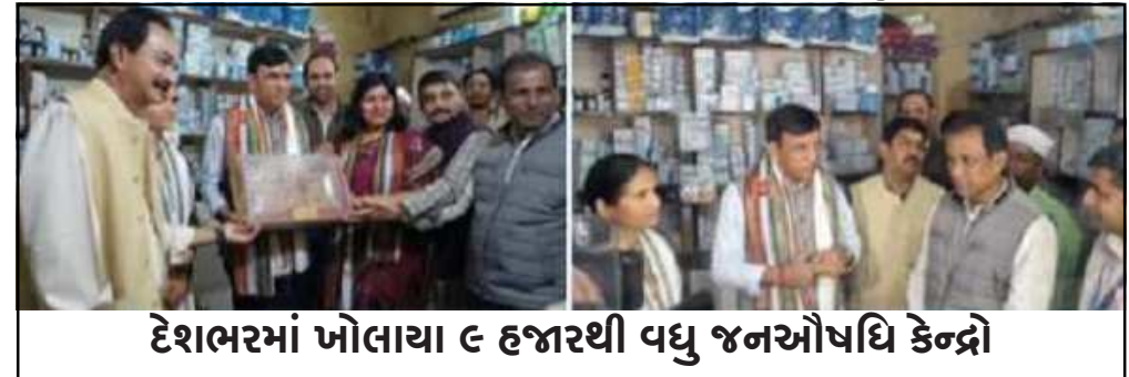
દેશભરમાં જોલાયા દ હજારથી વધુ જનઔષધિ કેન્દ્રો

(સૌરાષ્ટ્ર ક્રાંતિ કાર્યાલય-રાજકોટ) રાજકોટ, તા.૧૦ કેન્દ્રીય આરોગ્ય અને પરિવાર કલ્યાણ અને રસાયણ તેમજ ખાતર મંત્રી ડો. મનસુખ માંડવિયાએ ભુવનેશ્વરમાં બારામુંડા ક્ષેત્રમાં જન ઔષધિ કેન્દ્રની મુલાકાત લીધી હતી, તેમણે આ દરમિયાન ઘણા લાભાર્થીઓ સાથે વાત પણ કરી હતી.