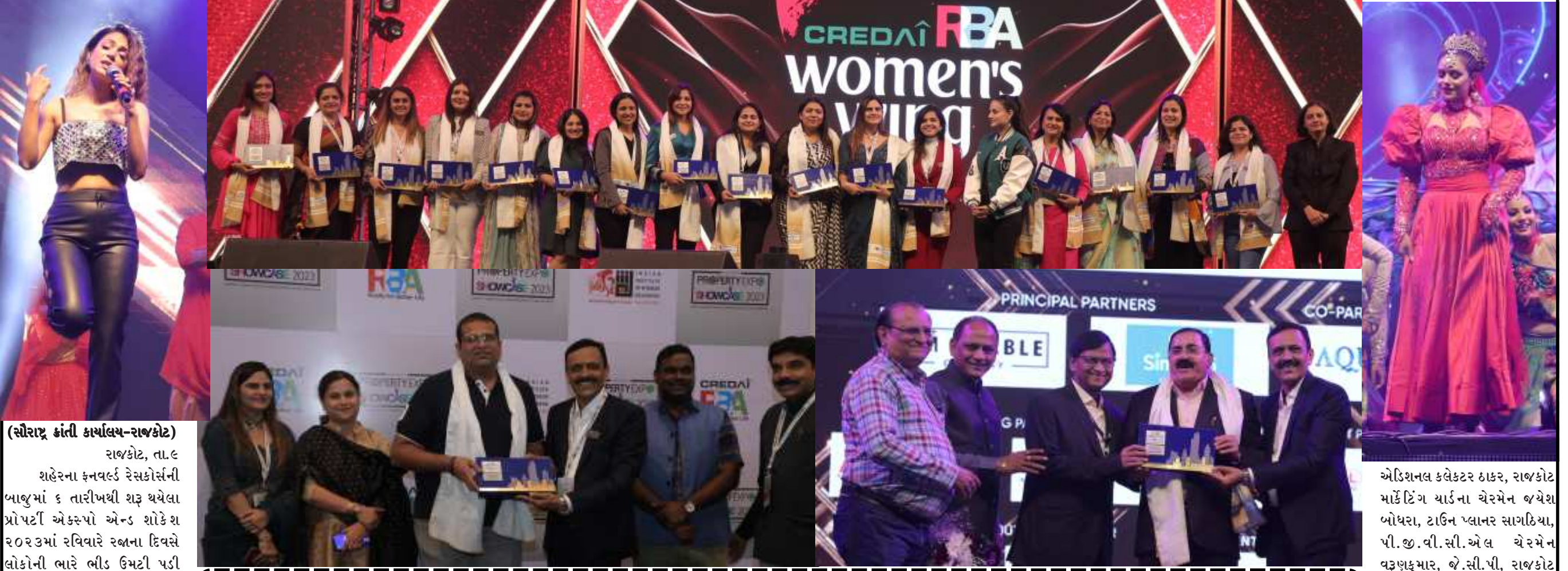
(સૌરાષ્ટ્ર ક્રાંતિ કાર્યાલય-રાજકોટ)

રાજકોટ, તા.૯ શહેરના ફનવર્લ્ડ રેસકોર્સની બાજુમાં ૬ તારીખથી શરૂ થયેલા પ્રોપર્ટી એક્સ્પો એન્ડ શોકેશ ૨૦૨૩માં રવિવારે રબના દિવસે લોકોની ભારે ભીડ ઉમટી પડી હતી. એક્સ્પોના તમામ ૬ એ.સી ડોમમાં પણ મુલાકાતીઓની હાજરી વધુ હતી. આ સમયે આયોજકોની ધારણા અનુસાર સાડા ત્રણ લાખથી વધુ લોકો ત્યાં સુધીમાં એક્સ્પોની મુલાકાત લઈ ચુક્યા હશે.