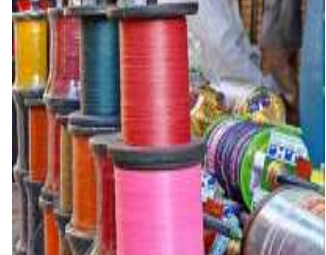
હાઈકોર્ટમાં દાખલ થયેલ પીટીશનની આજની સુનાવણી દરમિયાન નામદાર કોર્ટ દ્વારા દિશાનિર્દેશ આપવામાં આવ્યા હતા જેને ધ્યાને લઈ રાજ્ય સરકાર દ્વારા રાજ્ય વહીવટી તંત્રને જરૂરી સૂચનાઓ આપવામાં આવી છે.

ચાઈનીઝ દોરા, નાયલોન દોરા તથા ચાઈનીઝ લેન્ડર્નના ઉપયોગ પર મૂકવામાં આવેલ પ્રતિબંધનું ચુસ્તપણે પાલન કરાવા વહીવટી તંત્રને સૂચના (સૌરાષ્ટ્ર ક્રાંતિ કાર્યાલય-રાજકોટ) રાજકોટ, તા.૯ ચાઈનીઝ દોરા, નાયલોન દોરા તથા ચાઈનીઝ લેન્ડર્નના ઉપયોગ પર મૂકવામાં આવેલ પ્રતિબંધનું ચુસ્તપણે પાલન કરાવવા રાજ્ય સરકાર દ્વારા રાજ્યના વહીવટી તંત્રને સૂચના આપવામાં આવી છે એમ ગૃહ વિભાગની યાદીમાં જણાવવામાં છે. ઉત્તરાચલ દરમિયાન ચાઈનીઝ દોરા, માંબ, નાયલોન દોરા, ચાઈનીઝ લેન્ડર્ન તથા અન્ય નુકસાનકારક પદાર્થો બનેલી વસ્તુ પર પ્રતિબંધ મૂકવાની માંગણી સાથે ગુજરાત