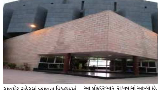
રાજકોટ શહેરમાં વ્યાજના વિષયકમાં ફસાયેલા લોકો માટે આવતીકાલે હેમુગઢવી હોલ ખાતે લોકદરબારનું આયોજન કરવામાં આવ્યું છે.

(સૌરાષ્ટ્ર ક્રાંતિ કાર્યાલય-રાજકોટ) રાજકોટ, તા.૯ ગુજરાતભરમાં વ્યાજના ચુંગાલમાં ફસાયેલા લોકોને છોડાવવા અને વ્યાજખોરો સામે કડક કાર્યવાહી કરવા ગુજરાત સરકારે આદેશ કરવામાં આવ્યા બાદ રાજકોટમાં છેલ્લા એક સપ્તાહમાં સાત થી વધુ વ્યાજખોરો સામે ગુના નોંધી કાર્યવાહી કરવામાં આવી હોય ત્યાર બાદ શહેર પો.કમિશનર રાજુ ભાર્ગવની અધ્યક્ષતામાં આવતીકાલે તા.૧૦ના રોજ હેમુગઢવી હોલ ખાતે લોકદરબારનું આયોજન કરવામાં આવ્યું છે. જેમાં પોલીસના ઉચ્ચ અધિકારીઓની હાજરીમાં વ્યાજખોરોનો ભોગ બનેલા લોકોની ફરિયાદ અને તેઓને વિસ્તારથી સાંભળવાનો સમય આપવામાં આવશે.