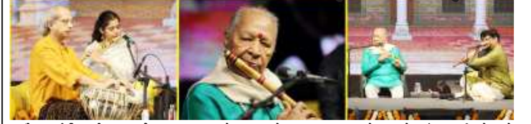
(સૌરાષ્ટ્ર ક્રાંતિ કાર્યાલય-રાજકોટ)

સમ સંગીતના સાતસુર સમા અંતિમ દિવસે પદ્મવિભૂષણ હરિપ્રસાદ ચૌરસીયાજીના વેણુનાદથી વુંદાવન બની ગયું હતું. તેમણે ૮૪ વર્ષની જૈક વયે યુવાનોને પણ શરમાવે તેવી ઉર્લા સાથે કાર્યક્રમ આપી શ્રોતાઓને કુત્હા કર્યા નિઝો રાજકોટ ફાઉન્ડેશન ટીમને ધન્યવાદ આપતા પંડિતજીએ કહ્યું કે આવા કાર્યક્રમોના આયોજનની પરંપરા અવિરત રહેવી જોઈએ જેથી વિશ્વકલક ઉપર ગુજરાત વ્યાપાર માટે જ નહી