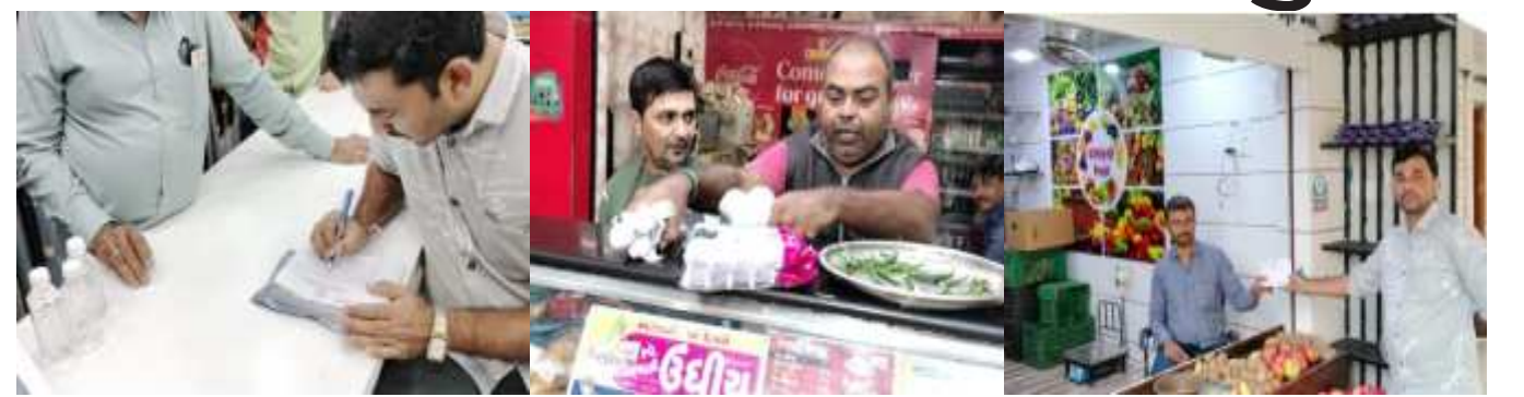
(સૌરાષ્ટ્ર ક્રાંતિ કાર્યાલય-રાજકોટ)

પ્લાસ્ટિક વેસ્ટ મેનેજમેન્ટ (એમેન્ડમેન્ટ) ફ્રેન્સ - ૨૦૨૧ અવધ્યે ૧૨૦ માર્કેટથી ઓછી જાડાઈની પ્લાસ્ટિક કેરી બેગ તેમજ સિંગલ યુઝ પ્લાસ્ટિક ઉત્પાદન, સંગ્રહ, વેચાણ, વપરાશ પર સંપૂર્ણ પ્રતિબંધ ફરમાવેલ છે. સિંગલ યુઝ પ્લાસ્ટિક અને ૧૨૦ માર્કેટથી ઓછી જાડાઈની પ્લાસ્ટિક કેરી બેગ વાપરવા સામે પ્રતિબંધ હોવા છતાં વેસ્ટ જોન ખાતેના માર્ગે જેવાકે શાસ્ત્રી નગર શાક માર્કેટ, પંચવટી મેઈન રોડ અતિથી ચોક, સાધુ વાસવાણી રોડ, સત્ય સર્થ રોડ, બાલાજી હોલ, મવડી