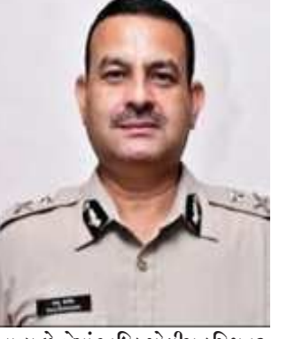
આવ્યું છે જેમાં અધિક પોલીસ કમિશનર સૌરભ તોલબીયા, નાયબ પોલીસ કમિશનર સુધીરકુમાર દેસાઈ, નાયબ પોલીસ કમિશનર (કાર્ડ) ડો. પાર્થરાજસિંહ ગોહીલ, નાયબ પોલીસ

કમિશનર સબજનરલ રામચંદ્ર ડીસીપી પૂજા યાદવ સહિતના ઉચ્ચ અધિકારીઓ તથા તમામ પોલીસ મથકના થાણા ઈન્ચાર્જની હાજરીમાં આ લોકદરબાર રાખવામાં આવ્યો છે. શહેરભરમાં વ્યાજખોરોનો ભોગ બનનાર અને વ્યાજખોરોની પહોંચી ઉઘરાણી કરતા ધમકીના કારણે પોલીસમાં ફરિયાદ નહીં કરનાર લોકોને નીર્ભય બની ફરિયાદ નોંધાવવા અનુરોધ કરવામાં આવ્યો છે. તથા વ્યાજના નાણા કેવી રીતના લઈ શકાય અને કેટલું વ્યાજ ચુકવી શકાય તથા કેવા પ્રકારના શરહી મંડળી કે નાણા ધીરવારનું લાયસન્સ ધરાવતા લોકો