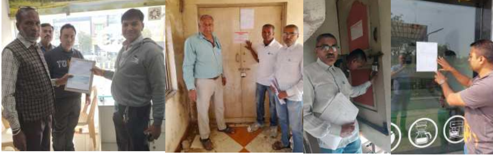
(સૌરાષ્ટ્ર ક્રાંતિ કાર્યાલય-રાજકોટ)

રાજકોટ મનપા દ્વારા રીકવરી ઝુંબેશ આરંભાઈ છે. તા.૯ ના સવારે ૧૨ કલાકે વેરા-વસુલાત શાખા દ્વારા ૧૧ મિલકતોને સીલ કરેલ હતા. તથા ૫૪ -મિલકતોને ટાંચ જમીની નોટીસ અર્પાઈ હતી. જ્યારે રૂ.૪૩.૯૨ લાખ રીકવરી કરાઈ હતી.