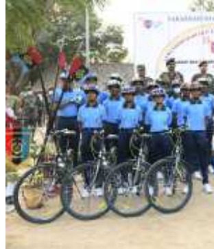
રાજ્યપાલ આચાર્ય દેવવ્રતજીએ આજે નેશનલ કેડેટ કોર એન.સી.સી.ના ૭૫ વર્ષની ઉજવણીના ભાગરૂપે 'આત્મનિર્ભર ભારતની યાત્રા, સ્વાવલંબન તરફ...' ના સંદેશ સાથે સાબરમતી આશ્રમથી દાંડી સુધીની સાયકલ રેલીને પ્રસ્થાન કરાવ્યું હતું.

ગાંધીનગર: રાજ્યપાલ આચાર્ય દેવવ્રતજીએ આજે નેશનલ કેડેટ કોર એન.સી.સી.ના ૭૫ વર્ષની ઉજવણીના ભાગરૂપે 'આત્મનિર્ભર ભારતની યાત્રા, સ્વાવલંબન તરફ...' ના સંદેશ સાથે સાબરમતી આશ્રમથી દાંડી સુધીની સાયકલ રેલીને પ્રસ્થાન કરાવ્યું હતું. આ પ્રસંગે તેમણે કહ્યું હતું કે, પૂજ્ય ગાંધીજીની પાવન ભૂમિથી આરંભાયેલી એન.સી.સી.કેડેટ્સની આ સાયકલ રેલી જ્યાં જ્યાંથી પસાર થશે તે પ્રદેશના યુવાનોમાં રાષ્ટ્રભક્તિ, સમર્પણ અને લોકસેવાનો ભાવ પ્રગટ કરશે. આત્મનિર્ભર ભારત માટે સ્વદેશી વસ્તુઓનો ઉપયોગ વધારવાનું આહ્વાન કરતાં રાજ્યપાલ આચાર્ય દેવવ્રતજીએ કહ્યું હતું કે પૂજ્ય મહાત્મા ગાંધીજીએ આઝાદીની લડત વખતે સ્વદેશી ચળવળ ચલાવી હતી અને નમક સત્યાગ્રહ કર્યો હતો. આ બંનેથી લોકોમાં બંધ અને ઉત્સાહ ઉમેરવા હતા. આજે આપણી અર્થ વ્યવસ્થાને વધુ સમૃદ્ધ કરવી હશે, આપણા ઉદ્યોગોને પ્રોત્સાહિત કરવા હશે તો ફરી એક વખત સ્વદેશી વસ્તુઓનો ઉપયોગ વધારવા સૌએ આગળ આવવું પડશે. તો આત્મનિર્ભર ભારત માટે આપણે વ્યક્તિગત યોગદાન આપી શકીશું. એન.સી.સી.ના યુવાનો હંમેશા અન્ય યુવાનો માટે પ્રેરણાનો સ્રોત રહ્યા