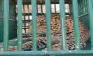
(મયુર ઠાકોર દ્વારા)

વાંકાનેરના ગ્રામ્ય વિસ્તારમાં દીપડાની રબંડ હોવાની વ્યાપક ફરિયાદ બાદ ડાલામથકા જેવા દીપડા વાંકાનેર પેડડ વિસ્તારમાં દિવિજનગર સુધી પહોંચ્યા હોવાની નાગરિકોની ફરિયાદ બાદ વનવિભાગ દ્વારા ગત અઠવાડિયે પાંજરા મુક્ત ગઈકાલે ગુરુવારે વહેલી સવારે ૬ વાગ્યે એક દીપડો પાંજરે પુરાયો હતો. આ ઉપરાંત વાંકાનેર નેશનલ હાઈવે ઉપર અબાણ્યા વાહન હડકેટે ચડી જતા એક ત્રણેક વર્ષના દીપડાનું મોત નિપળ્યા બાદ આજે વહેલી સવારે ૫.૩૦ કલાકે દિવિજનગરમાંથી