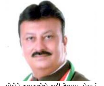
લોકોને રાખભરોસે મૂકી દેવાયા હોવાનું કોંગ્રેસના નેતાએ આક્ષેપ કર્યો હતો. તેમણે ટકોર કરી હતી કે, એસી કાર અને ચેમ્બરમાંથી બહાર નીકળી પ્રબલની પીડા સમજાવે ભાજપના ધારાસભ્યોએ પ્રબલને કરેલા વાયદા પુરા કરવા બોઈએ.(૨.૧૨)

(સોરાષ્ટ્ર ક્રાંતિ કાર્યાલય-રાજકોટ) રાજકોટ, તા. ૬ ગુજરાતમાં દાઝબંધી માત્ર કાગળ પર છે. વ્યાજબોરો પાસે રૂ.૮૯ લાખનો દાઝ પકડાયો એ તેનું ઉત્તમ ઉદાહરણ છે. મહત્વની વાત એ છે કે, સ્ટેટ મોનીટરીંગ સેલને દાઝ ભરેલા ત્રણ ટ્રક રાજકોટ આવી રહ્યાની ખાતરી હતી. બે કે બે જ ટ્રક પકડાયા એ અન્ય એક ટ્રક બંધ પહોંચાડવાનો હતો ત્યાં પહોંચી ગયો હશે એ નક્કી છે. બે પોલીસને બાંધી મળી હોય તો ગુજરાતની ચેકપોસ્ટ પર ફરજ બજાવતો સ્ટાફ બુંધ બુંધ આંખે ચોંકાઈ કરે છે? તેને આટલો મોટો બજ્યો દેખાતો નથી. એવા સવાલ કરતા તેમણે ટકોર કરી હતી કે, હમાબોરીથી જ બુટલેગરોનું સામ્રાજ્ય ચાલે છે. એટલે બે ટ્રક પકડનાર પોલીસ પણ વાહવાહીને લાયક નથી. નિવેદનમાં ઉમેર્યું હતું કે, માત્ર પોલીસને દોષ દેવાનું પણ યોગ્ય નથી. ફીક્ટેટ પ્રબલને વચનો આપી ચૂંટાયેલા ભાજપના પ્રતિનિધિઓ અને મંત્રીઓ દાઝબંધીની કડક અમલવારી કરાવી શક્યા નથી અને મુકપ્રેક્ષક બની તમાશો નિહાળતા રહે છે. ભાજપના ધારાસભ્યો અને મંત્રીઓ કહે છે કે, દારુ, જુગારનું દુષણ ડામી દેશું, વ્યાજબોરો પર તૂટી પડશે પણ આવા ખોટા બજાગા ફૂંકીને