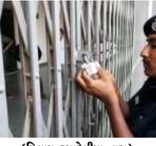
(વિલાપ રૂપારેલીયા દ્વારા)

ફાયર સેફ્ટી વિભાગે જે કોઈ બિલ્ડિંગમાં ફાયર સેફ્ટી નહી હોય તે તમામને સીલ કરવાની તૈયારી કરી