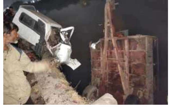
(વિલાપ રૂપારેલીયા દ્વારા)

અકસ્માતથી બોલેરો પીકઅપનો પાછળનો ભાગ તથા ટ્રેક્ટરની ટ્રોલીઅલગ થઈ ગયા (વિલાપ રૂપારેલીયા દ્વારા)