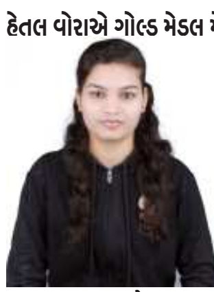
(મયુર ઠાકોર દ્વારા)

વાંકાનેર, તા. ૬ દોશી કોલેજની વિદ્યાર્થીની વોરા હેતલને ૨૦મી બન્યુઆરી ૨૦૨૩ના