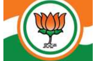
(સૌરાષ્ટ્ર ક્રાંતી કાર્યાલય-રાજકોટ) રાજકોટ, તા.૫ ગુજરાતમાં વિધાનસભા ચૂંટણીમાં ઉમેદવારોની પસંદગીમાં હવે આજે ભાજપ આખરી ૭૭ ઉમેદવારોની પસંદગી સાથે તમામ ૧૮૨ નામોની પેનલ બનાવી લેશે અને તા. ૬ તથા ૧૦ દિલ્હીમાં કેન્દ્રીય પાલમિન્ટરી

આવતીકાલે મુખ્યમંત્રીના નિવાસી સ્થાને કોર ગુપની બેઠક: સુરત સહિત ૭૭ બેઠકો માટે આજે ઉમેદવારોની પેનલ બનાવવાની ચર્ચા ચાલુ