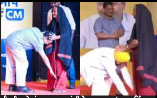
દિલ્હી અને પંજાબના મુખ્યમંત્રીએ ચારણ આઈના આર્શિવાદ લીધાની તમ્બીરો સોશિયલ મીડિયામાં મોટા પ્રમાણમાં વાયરલ

જ સ્પષ્ટ સલાહ આપી હતી કે, ભલે મુકે લીઓ નડે પણ પત્રકારિત્વ છોડવાનું નથી. એમણે દક્ષિણ ગુજરાતમાં રહીને પણ ગુજરાતી ચેનલમાં રહીને સુંદર કામગીરી બજાવી હતી.