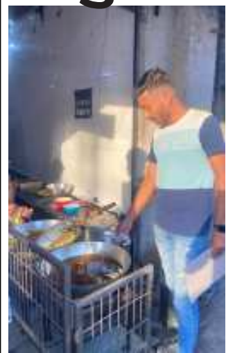
(સૌરાષ્ટ્ર ક્રાંતી કાર્યાલય-રાજકોટ) રાજકોટ, તા.૫ રાજકોટ મહાનગરપાલિકાના ફૂડ વિભાગ દ્વારા શહેરના અલગ-અલગ વિસ્તારોમાં ખાણી-પીણીની દુકાનો પર ગુણવત્તા ચકાસણીની ઝુંબેશ આગળ વધારવામાં આવી હતી. કુલ ૨૦ જેટલા ધંધાર્થીઓને ત્યાં તપાસ કરવામાં આવી હતી. દૂધની બનાવટ, ઠંડાપીણા, મસાલા, બેકરી પ્રોડક્ટ્સ, ખાદ્યતેલો વગેરેના કુલ ૧૯ નમુનાનું સ્થળ પર ચેકિંગ કરવામાં આવ્યું હતું.

અલગ-અલગ સ્થળે ચેકિંગ કરી દૂધની બનાવટ, મસાલા, ખાદ્યતેલ સહિત ૧૯ નમુનાનું સ્થળ પર ચેકિંગ કરવામાં આવ્યું હતું. જય ખોડીયાર ફરસાણ, ભગવતી ફરસાણ, જય બાલાજી ચાઈનીઝ એન્ડ પંજાબી, શક્તિ ડેરી ફાર્મ, સ્વામી નારાયણ ફરસાણ, અશોક બેકરી, ન્યુ આદિનાથ સ્વીટ સેન્ટર વગેરે સ્થળે નમુના લઈને ચેકિંગ કરવામાં આવ્યું હતું. કુલ ૬ જેટલી પેટીની લાયસન્સ અંગે નોટીસ અપાઈ હતી. રણજી મંદિર પાસે નંદનવન ડેરી ફાર્મમાંથી મિક્સ દુધ લુઝ અને રણછોડનગર શેરી નં.૨૬ ન્યુ રામેસ્ટર ડેરી ફાર્મમાંથી મિક્સ દૂધ લુઝના બે નમુના લેવામાં આવ્યા હતા.