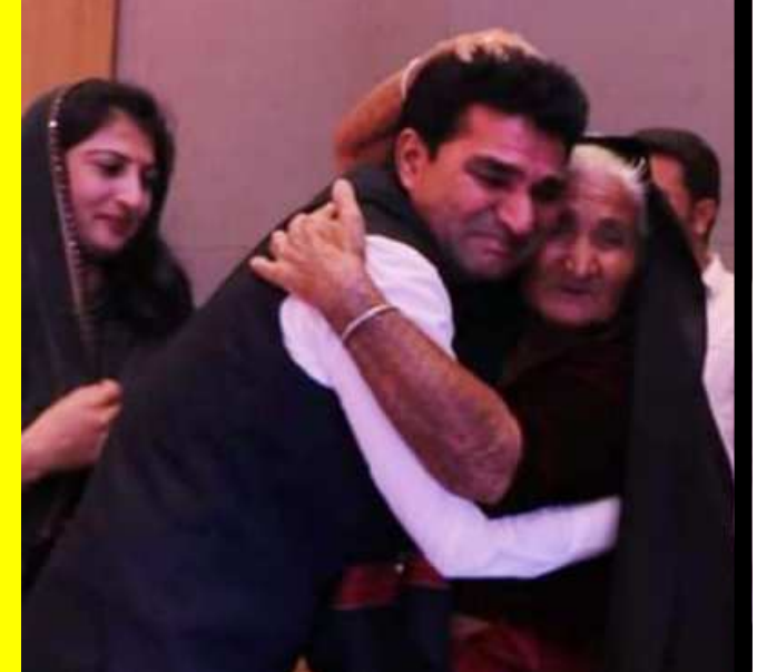
ઇસુદાન ગઢવીનું મુખ્યમંત્રી તરીકે પક્ષે નામ જાહેર કરતા ભાવુક બન્યા હતા

પત્રકાર આલમમાં અનેરી ખુશાલીનો વાતાવરણ, જો એક ચા વેચવાવાળી વ્યક્તિ દેશના વડાપ્રધાનના પદ સુધી પહોંચી શકે તો એક વ્યવસાયી પત્રકાર મુખ્યમંત્રી ન બની શકે?