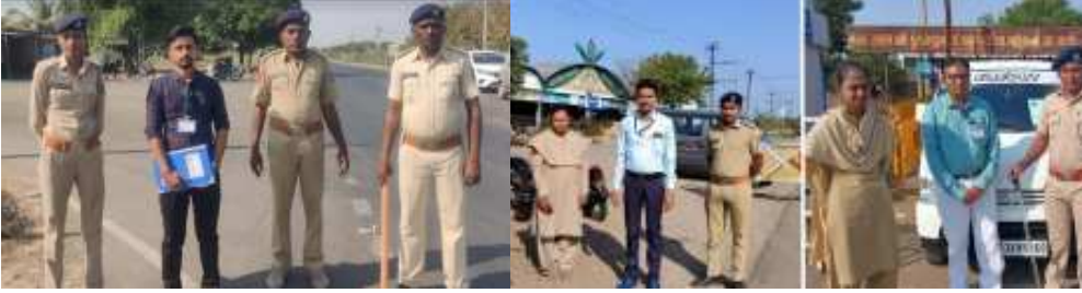
(પંચેશ કલ્યાણી દ્વારા) જસદણ, તા. ૫ જસદણ વિધાનસભા

લીલા શાકભાજીની આવક વધી રહી છે જેથી ભાવમાં પણ નોંધપાત્ર થઈ આવ્યો છે. શુક્રવારે જૂના ચાંદલીમાં લીલા શાકભાજી વિભાગમાં સૌથી વધુ આવક રૂ. ૭૮,૬૦૦ કિલોની થઈ હતી. આવક વધવાની સાથે જ ભાવમાં ઘટાડો આવ્યો છે. ચાંદલીમાં એક કિલો રૂ. ૧૨૫ થી રૂ. ૧૨૦ બોલાયો હતો. જ્યારે અગાઉ તેનો ભાવ રૂ. ૧૦ થી ૬૦ હતો.