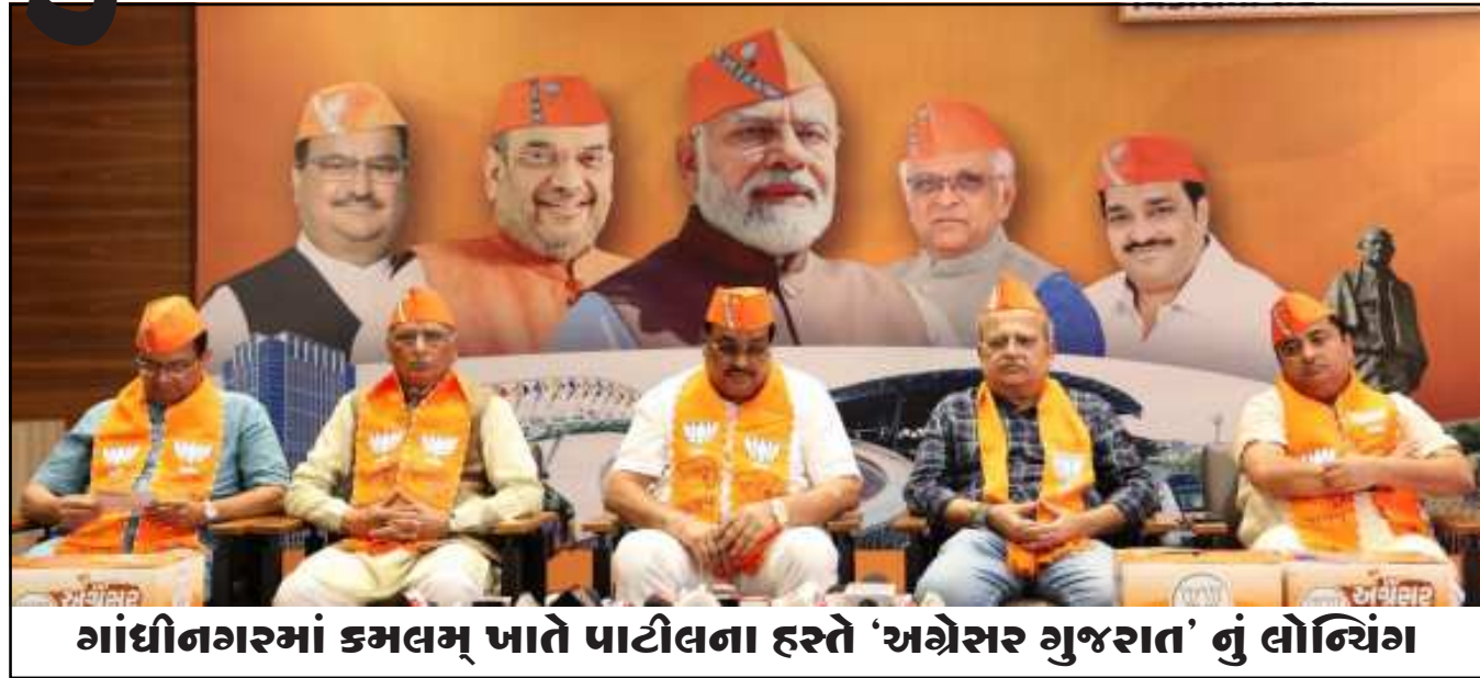
ગાંધીનગરમાં કમલમ્ જાતે પાટીલના હસ્તે 'અગ્રેસર ગુજરાત' નું લોન્ચિંગ

(સૌરાષ્ટ્ર ક્રાંતી કાર્યાલય-રાજકોટ) ચૂંટણીઓમાં સંકલ્પ પત્ર તૈયાર કરવાની ખાસ ઝુંબેશ શરૂ કરવામાં આવી છે. આ તકે ભાજપના પ્રદેશ અધ્યક્ષ સી.આર.પાટીલે સૂચક ઘોષણા કરી હતી કે, ભાજપ કોઈ નેતાના સગાને ટિકિટ આપશે નહીં.