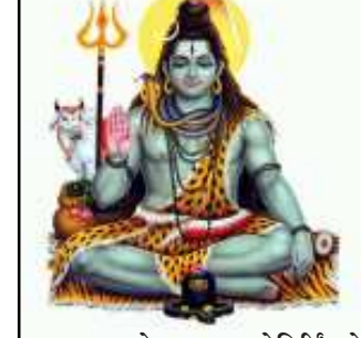
રાજકોટ: ૧૨ જ્યોતિર્લિંગનો મહત્વ અને મહિમા. ભગવાન શિવની ભક્તિનો મહિનો ચાલુ છે. શિવમહાપુરાણ અનુસાર, એકમાત્ર ભગવાન શિવ એકમાત્ર દેવતા છે જે નિરર્થક અને સફળ બને છે. આ જ કારણ છે કે એકમાત્ર શિવની પૂજા લિંગ અને મૂર્તિ બંને સ્વરૂપોમાં કરવામાં આવે છે. ભારતમાં ૧૨ મોટા જ્યોતિર્લિંગ છે. આ બધાનું પોતાનું મહત્વ અને મહિમા છે. એવું પણ માનવામાં આવે છે કે બે સાવન મહિનામાં ભગવાન શિવના જ્યોતિર્લિંગો ભોવામાં આવે તો જન્મ પછી જન્મની સમસ્યાઓ દૂર થાય છે. આ જ કારણ છે કે સાવન મહિનામાં ભારતના ૧૨ જ્યોતિર્લિંગોની મુલાકાત માટે ભકતો ઉમટતા હોય છે. આજે અમે તમને આ ૧૨ જ્યોતિર્લિંગનું મહત્વ અને મહિમા બાણીએ.