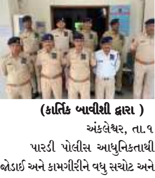
(કાર્તિક બાવીશી દ્વારા) અંબલેશ્વર, તા.૧૫ પારડી પોલીસ આધુનિકતાથી બેડાઈ અને કામગીરીને વધુ સચોટ અને

પ્રમાણિક બનાવે તે હેતુથી પારડી પોલીસ માટે ૧૧ બોડી વોર્ન કેમેરા ફાળવવામાં આવ્યા છે. બોડી વોર્ન કેમેરાની ઉપયોગિતાની તાલીમ સાથે ૧૧ પોલીસ કર્મચોરોને બોડી વોર્ન કેમેરા અપાયા છે. જે પોલીસ કર્મી પોતાના બોડી (ડ્રેસ) પર બોડી વોર્ન કેમેરા ફિક્સ કર્યા બાદ શહેરમાં ટ્રાફિક નિયમોનું પાલન, પ્રોટેલીંગ કે પછી, પ્રોહિબિશન રેડ સહિત ચેકિંગ કામગીરી કરશે,