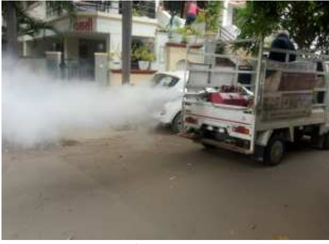
(સૌરાષ્ટ્ર ક્રાંતિ કાર્યાલય-રાજકોટ) ચિત્રનગરના અને મેલેરિયા કેસો રાજકોટ, તા. ૧ ચોમાસાની ત્રુટી દરમિયાન રાજકોટ શહેરમાં નોંધપાત્ર વરસાદ થયેલ છે. વરસાદની ત્રુટી દરમિયાન મીઠા ત્રુટી અને અનુકૂળ વાતાવરણ મેળવતાં ડેન્ગ્યુ, રાજકોટ મહાનગર પાલિકાના