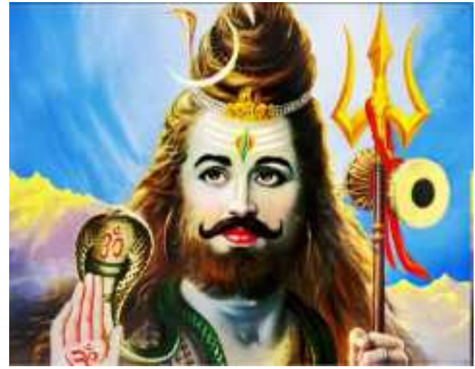
ચડાવવાથી ગ્રહ પીડાનાશ પામે છે. કોટેશ્વર મહાદેવ મંદિરે શ્રધ્ધા-ભક્તિના દર્શન ભાવિકો દ્વારા થશે. ધર્મપ્રેમી

રાજકોટ: કોઠારીયા કોલોનીના આસ્થા પ્રતિક સમા કોટેશ્વર મહાદેવ મંદિરે શ્રાવણ માસ પ્રથમ સોમવારે પુનઃ પ્રાણ પ્રતિષ્ઠાનો આદ્યમ પાટોત્સવ ધામધુમથી યોજાશે. શિવજીનું પૂજન-અર્ચન કરવામાં આવશે. સમગ્ર મંદિરને રોશનીથી સુશોભન કરવામાં આવેલ છે. સાંજે કોટેશ્વર મહિલા મંડળ દ્વારા ધૂન-ભજનની રમઝટ યોજાવામાં આવશે. ભગવાન શિવજીને ગુલાબના પુષ્પોનો શ્રંગાર-દર્શન યોજાશે.