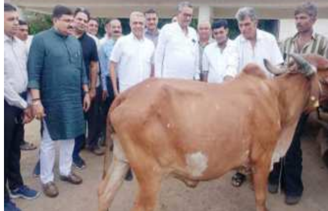
રાજકોટ ડેરી દ્વારા ૪૨૮ દૂધ મંડળીઓ સાથે મળી ૧.૬૫ લાખ પશુઓની રસીકરણ કામગીરી પૂર્ણ