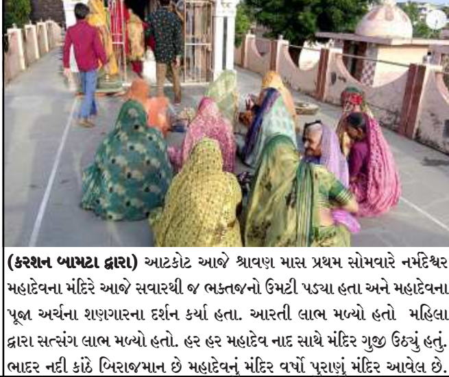
(કરશન બાપટા દ્વારા) આટકોટ આજે શ્રાવણ માસ પ્રથમ સોમવારે નર્મદેશ્વર મહાદેવના મંદિરે આજે સવારથી જ ભકતજનો ઉમટી પડ્યા હતા અને મહાદેવના પૂજા અર્ચના શરૂઆતના દર્શન કર્યા હતા. આરતી લાભ મળ્યો હતો. મહિલા દ્વારા સત્સંગ લાભ મળ્યો હતો. હર હર મહાદેવ નાદ સાથે મંદિર ગુજી ઉઠ્યું હતું. ભાદર નદી કાંઠે બિરાજમાન છે મહાદેવનું મંદિર વર્ષો પુરાણું મંદિર આવેલ છે.