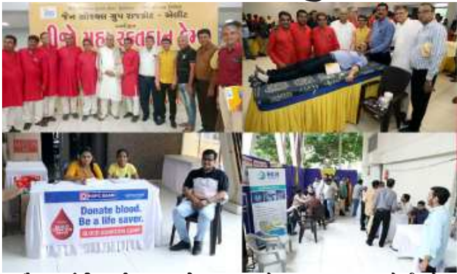
(સૌરાષ્ટ્ર કાંતી કાર્યાલય-રાજકોટ) રાજકોટ, તા.૧ જૈન સોશિયલ ગ્રુપ રાજકોટ એલીટ આયોજીત ગત તા.૩૧ રવિવારના રોજ મેગા બ્લડ ડોનેશન કેમ્પનું

આયોજન જનકલ્યાણ એસી હાલ, જનકલ્યાણ સોસાયટી, એસ્પ્રોન ચોકખાતે રેફરેઈ બ્લડ બેન્ક, ફીલ્ડ માર્શલ બ્લડ બેન્ક અને સિવિલ હોસ્પિટલ બ્લડ બેન્કના સહયોગથી કરવામાં આવેલ હતું.