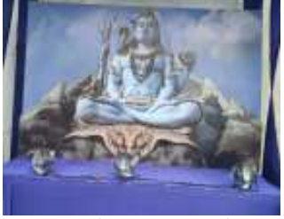
રાજકોટ: ભાવનગર રોડ પર આવેલ ત્રંબા ગામ મુકામે આવેલ મોહનધામ આશ્રમ ખાતે તા.૨ થી

૬ ઓગસ્ટ સુધી ૧૨૧ કુંડી અતિ મહાદેવની ભવ્યભવ્ય આયોજન કરવામાં આવ્યું છે જેની તૈયારીને આજે આખરી ઓપ અપાયો છે. આ યજ્ઞ શાંતિ તેમજ પર્યાવરણ શુદ્ધિકરણ માટે આગવું મહત્વ ધરાવે છે. પરમ પૂજ્ય સંત શ્રી શામળા બાપાના આશીર્વાદ તેમજ