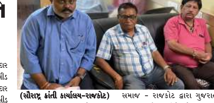
(સૌરાષ્ટ્ર ક્રાંતિ કાર્યાલય-રાજકોટ) રાજકોટ, તા.૧૫ સૌરાષ્ટ્ર કચ્છ સમસ્ત બહમ