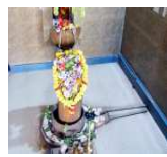
માંગરોળ: પવિત્ર શ્રાવણ માસનો ત્રણ દિવસ પહેલાં પ્રારંભ થયો છે. શ્રાવણ મહિનાના પ્રારંભથી શિવાલયોમાં ઓમ નમ: શિવાય હર હર મહાદેવના નાદ ગુંજી રહ્યા છે. ભાવિક ભકતો ભોળાનાથના મંદિરે બિલીપત્ર, પુષ્પ, જલાભિષેક, દુધ અભિષેક સાથે ભોળાનાથની ભક્તિ કરી રહ્યા છે. ત્યારે આજે આપણે માંગરોળ તાલુકાના કારેજ ગામે આવેલ પ્રાચિન અને ઐતિહાસિક કાળેશ્વર મહાદેવ વિશે બોદીએ તો માંગરોળ તાલુકાના કારેજ ગામે અતિ પૌરાણિક અને ઐતિહાસિક કાળેશ્વર

કાળેશ્વર મહાદેવ મંદિરના હાલના પૂજારીના ચાર પેઢીના પૂર્વજ પૂજારી કનડગરબાપુ રાજશાહી વખતમાં કાળેશ્વર મહાદેવ મંદિરની પૂજા કરતા જે તે સમયનું કૃપિયાનું ચલણ સોનાની કોરી હતું ત્યારે પાંચ કોરી મંદિરની અંદરથી પૂજારીને દરરોજ મળતા હતા જે વાત પૂજારી કોઈને કહી ન હતી પણ ભગવાન ભોળાનાથની કૃપા થઈ રહી છે એમ મનોમન સમજી ગયા સમય જતા પૂજારી ગામમાં ખેડૂતને ત્યાં શીખ માંગવા ગયા ત્યારે ખેડૂતે જે શીખ આપેલ તે કદાચ ઓછી હોય એટલે પૂજારીએ ખેડૂતને સંભળાવ્યું કે તારા જેવા શું આપતા મને મારો ભોળોનાથ મંદિરમાં દરરોજ પાંચ કોરી આપે છે. ત્યારથી મંદિરમાંથી દરરોજ મળતી પાંચ કોરી પૂજારીને મળતી બંધ થઈ ગઈ હતી તેવી પણ લોકવાયકા છે. કારેજ ગામે આવેલ કાળેશ્વર મહાદેવ મંદિરે આશરે ત્રણેક દશકા