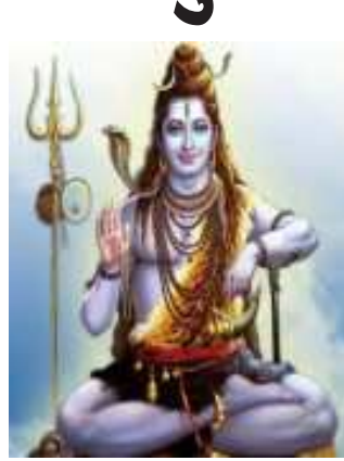
પીડા દૂર કરવા, રાજકોટની અંદર પ્રગટિ માટે, ચામડીના દર્દ, આંતરડાના દર્દ, ડાયાબીટીસ, હીવર, ગુમ ભાગના રોગ, છાતીમાં દર્દો, વાયુ વિકાર, બ્લડ પ્રેસર દૂર કરવા માટે ઝૂં બુદ્ધસ્પત્યે

(સૌરાષ્ટ્ર કાંતી કાર્યાલય-રાજકોટ) રાજકોટ, તા.૨૯ શાસ્ત્રી કાર્તિકભાઈ ઠાકર (જુના પાસે મેંદરડા નાની ખોડીવાર)ની યાદી જણાવે છે કે, ગુરુપુષ્પ નક્ષત્રમાં કોઈપણ કાર્ય કરતા સિધ્ધ થાય, સોના-ચાંદીની ખરીદી કરવી ઉત્તમ ગણાય. દિવાસો ગુરુ પુષ્પ નક્ષત્ર અને અમાસનો સંગમ હોઈ મહાદેવની પૂજા કરવી અને જળ અભિષેક પુષ્પ ચડાવવાથી મહાદેવની કૃપા પ્રાપ્ત થાય છે. મહાભયુલ્બય મંત્રનું સ્મરણ અતિ લાભદાયક ગણાય. લક્ષ્મી પ્રાપ્તિ માટે ઝૂં મહાલક્ષ્મી નમઃ મંત્ર કરવો પણ અતિ ઉત્તમ ગણાય. આજે કોઈ મોટી માંદગીમાંથી મુક્ત થવા તો સૂર્યનારાયણના પાઠ કરવા ઘરની અંદર કંકાસ ઝયડો દૂર કરવા માટે હનુમાન ચાલીસાના પાઠ કરવા.