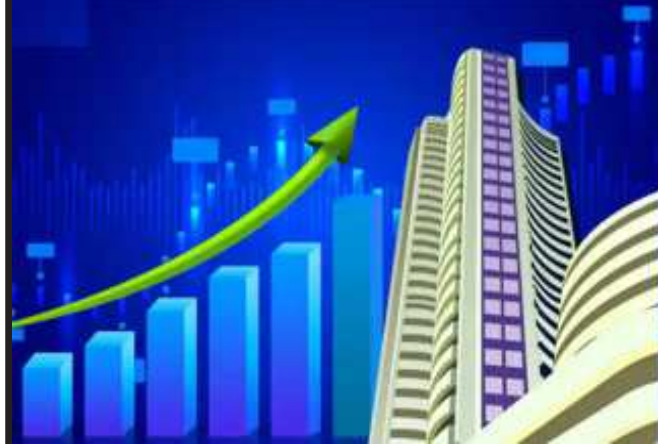
(એજન્સી સમાચાર) શેરબજારમાં સેન્સેક્સ મુંબઈ, તા. ૨૯ ઉઘડતામાં વધુ ૭૦૦ પોઇન્ટના