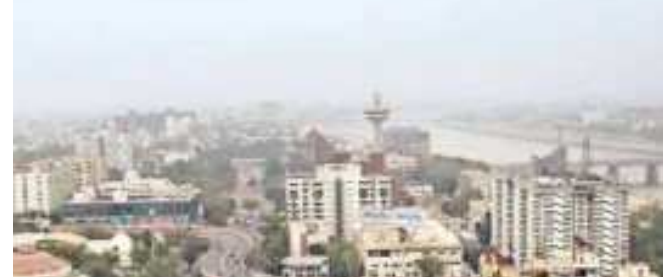
વિસ્તારોમાં ઉઘાડનો જ માહોલ હતો. માત્ર ૪૧ તાલુકામાં આપટા-હળવો વરસાદ પડ્યો હતો. સૌથી વધુ ૧૭ મીમી વરસાદ ગાંધીનગરના કલોલમાં વરસ્યો હતો. માત્ર ૧૧ તાલુકામાં ૧૦ મીમી કે તેથી વધુ વરસાદ હતો. બાકીમાં સામાન્ય આપટા જ પડ્યા હતા. રાજ્યમાં અત્યાર સુધીમાં કુલ વરસાદ ૫૯૩.૯૩ મીમી થયો છે જે સીઝનના ૬૯.૮૬ ટકા થવા બાકી

ગુજરાતમાં સીઝનનું ૬૯.૮૬ ટકા પાણી વરસી ગયું (સોસ્ટ્રા કાંતી કાર્યાલય-રાજકોટ) રાજકોટ તા. ૨૯ રાજ્યભરમાં ઉઘાડનો માહોલ રહ્યો હતો. માત્ર અમુક વિસ્તારોમાં છુટાછવાયા આપટા વરસતા હતા. રાજ્યમાં અત્યાર સુધીમાં સરેરાશ ૬૯.૮૬ ટકા વરસાદ પડ્યો છે. સ્ટેટ ઈમરજન્સી ઓપરેશન સેન્ટરના રીપોર્ટ પ્રમાણે છેલ્લા ચોવીસ કલાક દરમિયાન રાજ્યના મોટાભાગના