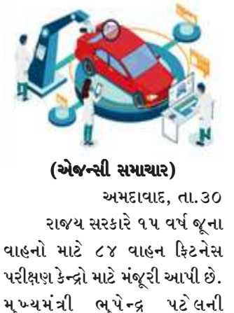
(એજન્સી સમાચાર) અમદાવાદ, તા.૩૦ રાજ્ય સરકારે ૧૫ વર્ષ જૂના વાહનો માટે ૮૪ વાહન ફિટનેસ પરીક્ષણ કેન્દ્રો માટે મંજૂરી આપી છે. મુખ્યમંત્રી ભુપેન્દ્ર પટેલની

મુખ્યમંત્રી ભુપેન્દ્ર પટેલની અધ્યક્ષતામાં મળેલી ઉચ્ચસ્તરીય બેઠકમાં આ નિર્ણય લેવામાં આવ્યો હતો. કેન્દ્રો પીપીપી મોડ હેઠળ સ્થાપિત કરવામાં આવશે. અઈજ પોર્ટ્સ અને ટ્રાન્સપોર્ટ મનોજ દાસે જણાવ્યું હતું કે ૯૦ કેન્દ્રો માટે અરજીઓ મળી હતી, જેમાંથી ૮૪ મંજૂર કરવામાં આવી હતી. રાજ્ય અને હજુ ફી નક્કી કરવાની બાકી છે અને સરકારે રેવન્યુ શેરિંગ મોડલને પસંદ ન કરવાનો નિર્ણય લીધો છે. કેન્દ્ર સંચાલકો ફી વસૂલ કરશે અને આનાથી વધુ લોકોને આવા કેન્દ્રો સ્થાપવા પ્રોત્સાહિત થશે, એમ દાસે જણાવ્યું હતું. સંપૂર્ણ સ્વચાલિત કેન્દ્રો માનવ હસ્તક્ષેપ વિના ચલાવવામાં આવશે અને જે વાહનો ત્રણ વખત ફિટનેસ ટેસ્ટમાં નિષ્ફળ જશે તેને સ્કેપ કરવામાં આવશે, એમ તેમણે જણાવ્યું હતું. સ્કેપ પોલીસી ભારે વાહનો માટે માર્ચ ૨૦૨૨ અને હળવા વાહનો માટે માર્ચ ૨૦૨૪થી અમલમાં આવશે. વાહન ફિટનેસ કેન્દ્રોની સ્થાપનાથી વિપરીત, ઘણી ઓછી કંપનીઓએ સ્કેપ કેન્દ્રો સ્થાપવામાં રસ દાખવ્યો છે. કેન્દ્ર અલંગને સ્કેપ ચાર્જ તરીકે વિકસાવવાની યોજના ધરાવે છે કારણ કે તેમાં વાહનોને સ્કેપ કરવા માટે મૂળભૂત ઈન્ફ્રાસ્ટ્રક્ચર છે. રાજ્ય એવું પણ માને છે કે તે બંદરોની નજીક હોવાથી અન્ય એશિયન દેશો માટે વાહન સ્કેપિંગ માટે પણ તે એક મહત્વપૂર્ણ કેન્દ્ર બની શકે છે. પરિવહન વિભાગના એક વરિષ્ઠ અધિકારીએ જણાવ્યું હતું કે, હજુ સુધી સ્કેપ સેન્ટર સ્થાપવા માટે કોઈ કંપનીની પસંદગી કરવામાં આવી નથી. (૯)