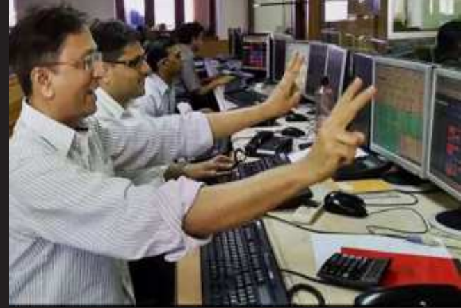
શેરબજારમાં આજે ભારતી એરટેલ, બજાજ ફીન સર્વિસ, ઇન્ફોસીસ, કોટક બેંક, લાર્સન, માફિનિ, નેસલે, પાવરગ્રીડ, રિલાયન્સ, ટીસીએસ, ટીસ્કો, ટાઇટન, એશિયન પેઇન્ટ્સ વગેરે ઉચ્ચકાયા હતા. મુંબઈ શેરબજારનો સેન્સિટીવ ઇન્ડેક્સ ૬૨૧ પોઇન્ટના ઉછાળાથી ૫૭૭૭૯ હતો તે ઉંચામાં ૫૭૫૩૧ તથા નીચામાં ૫૭૨૫૫ હતો. નિક્ટી પણ ૧૭૨૦૦ની સપાટી વટાવી ગયો હતો અને ૨૨૦ પોઇન્ટના ઉછાળાથી ૧૭૧૪૧ તથા નીચામાં ૧૭૦૫૯ ૧૭૧૨૭ સાંપડ્યો હતો. જે ઉંચામાં થયો હતો. (૯)

કારણોને ડીસ્કાઉન્ટ કરીને માર્કેટ હરણકણ ભયાનું ચિત્ર હતું. વિશ્વસ્તરે નબળા આર્થિક સંદેહો છતાં વિદેશી ઇન્વેસ્ટરો, ફરી વખત લેવા દોડતા તેજને ટેકો મળ્યો હતો. ગઈકાલે વિદેશી ઇન્વેસ્ટરોએ ૩.૧૩૦૦ કરોડથી પણ અધિકની નેટ ખરીદી કરી હતી. ૯ મહિના બાદ ચાલુ મહિનામાં વિદેશી નેટ રોકાણ થવાનો આશવાદ વ્યક્ત થતો હતો. ભણીતા શેરબ્રોકરોનાં કહેવા પ્રમાણે વિદેશી