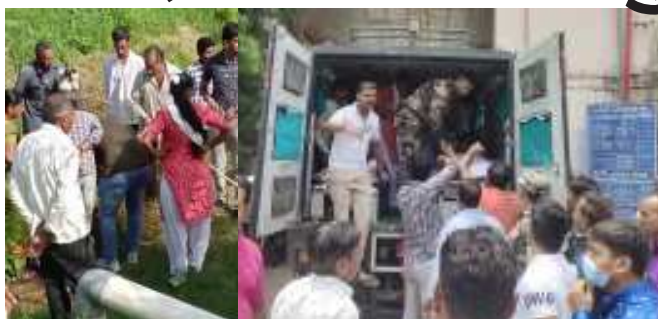
(એજન્સી સમાચાર) ધ્રાંગધ્રાના ગાજણાવાવમાં સવારે સુરેન્દ્રનગર, તા.૨૯ ૭૩૦ વાગ્યે ૬૦૦ ફૂટ ઊંડા બોરમાં

આદિવાસી પરિવારની કિશોરી પડી હતી અને ૬૦ ફૂટે ફસાઈ હતી. બોરમાં ફસાયેલી કિશોરીને બચાવવા માટે આર્મી, પોલીસ સહિતનો કાફલો ઘટનાસ્થળે પહોંચ્યો હતો. કિશોરીને બચાવવા માટે આર્મી દ્વારા દિલધડક ઓપરેશન હાથ ધરવામાં આવ્યું હતું અને બોરમાંથી તેને હેમખેમ બહાર કાઢી હતી. તેને બચાવવા માટે ૪ કલાક રેસ્ક્યુ-ઓપરેશન ચાલ્યું હતું. સુરેન્દ્રનગર જિલ્લાના ધ્રાંગધ્રા