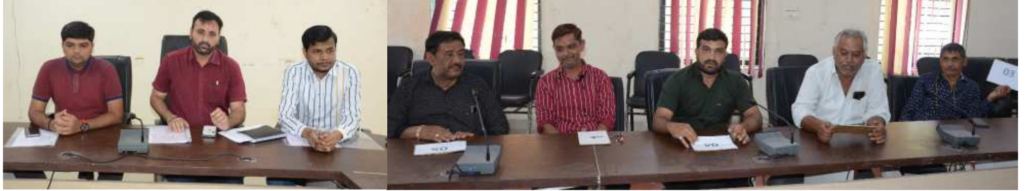
કાલે યાંત્રિક આઈટમના ૪૪, તા.૩૦મીએ આઈસ્ક્રીમના ૧૬ પ્લોટની ફાળવણી કરાશે