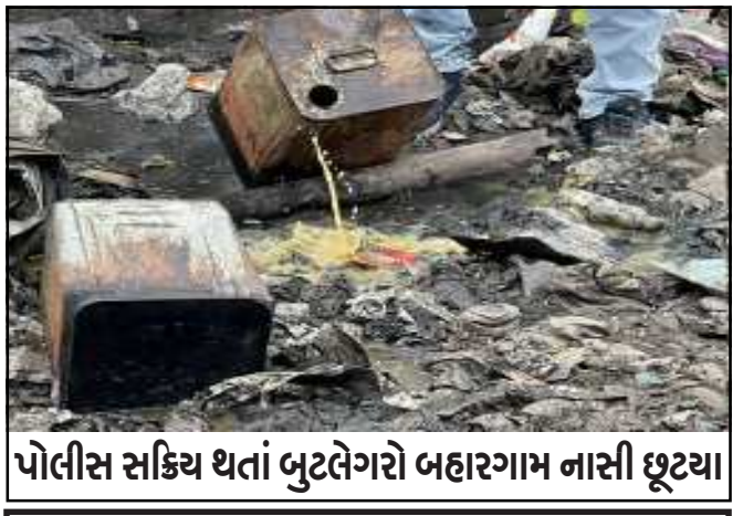
પોલીસ સક્રિય થતાં બુટલેગરો બહારગામ નાસી છૂટ્યા

શાપર-વેરાવળમાં ૧૨ અને જિલ્લાના અન્ય ૩૪ સ્થળોએથી ૨૬૩ લીટર દેશી દારૂ કબ્જે: ૫૬ બુટલેગરો (સોરઠ પ્રતિનિધિ-રાજકોટ) રાજકોટ, તા.૨૭ ખોટાદના બરવાળા ગામે સભ્યેલા કથિત લઘુકાંડ બાદ રાજ્યભરમાં પોલીસને દેશી દારૂના બુટલેગરો પર તુટી પડવા આદેશ મળ્યો હોય રાજકોટ જિલ્લામાં પણ સ્થાનિક પોલીસની અલગ અલગ ટીમોએ દરોડા પાડ્યા હતાં અને ૨૫૦ જેટલા સ્થળોએ પોલીસે તપાસ કરી ૫૬ બુટલેગરો વિરુદ્ધ કાર્યવાહી કરી હતી. જ્યારે ૧૮૩