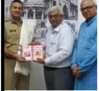
(સૌરાષ્ટ્ર ક્રાંતિ કાર્યાલય-રાજકોટ)