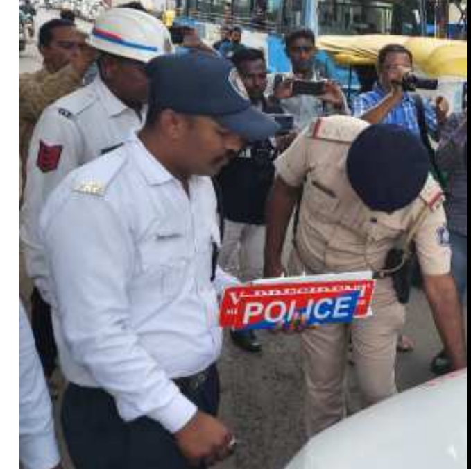
એકને ગોળ અને બીજાને ખોળની નીતિ અપનાવી પોલીસે પ્રજાનો વિશ્વાસ ગુમાવ્યો: મહેશ રાજપૂતના આકરા પ્રહારો