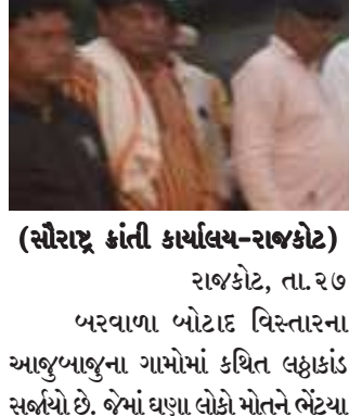
(સૌરાષ્ટ્ર ક્રાંતિ કાર્યાલય-રાજકોટ) રાજકોટ, તા.૨૭