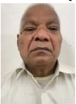
(સૌરાષ્ટ્ર ક્રાંતિ કાર્યાલય-રાજકોટ)