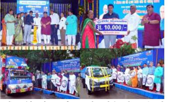
(સૌરાષ્ટ્ર કાંતી કાર્યાલય-રાજકોટ) રાજકોટ, તા. ૬

ભારતની આઝાદીના ૭૫ વર્ષ નિમિત્તે સમગ્ર દેશમાં આઝાદી કા અમૃત