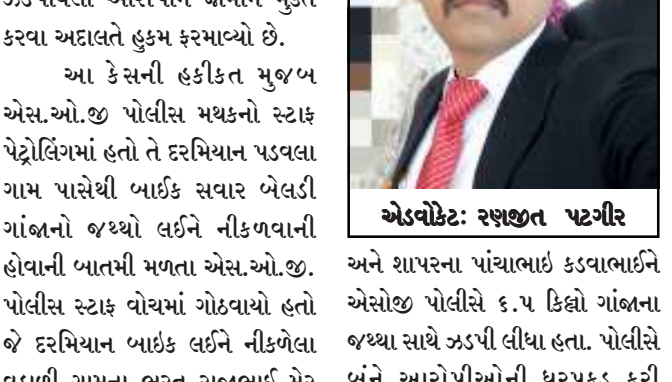
(સૌરાષ્ટ્ર ક્રાંતિ કાર્યાલય-રાજકોટ) રાજકોટ, તા. ૬ શાપર પાસે આવેલા પડવલા ગામ પાસેથી ૬.૫ કિલો ગાંજા સાથે ઝડપાયેલા આરોપીને જામીન મુક્ત કરવા અદાલતે હુકમ કરમાવ્યો છે.