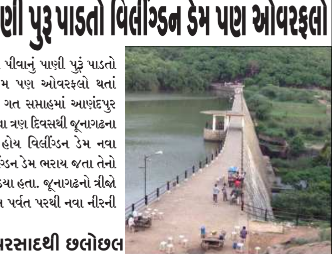
જૂનાગઢને પીવાનું પાણી પુરૂ પાડતો આણંદપુર ડેમ બાદ વિલીંગ્ડન ડેમ પણ ઓવરફ્લો થતાં નગરજનોમાં ખુશી વ્યાપી ગઈ છે. ગત સપ્તાહમાં આણંદપુર જળાશય છલોછલ થઈ ગયા બાદ છેલ્લા ત્રણ દિવસથી જૂનાગઢના દાતાર વિસ્તારમાં સતત વરસાદ હોય વિલીંગ્ડન ડેમ નવા પાણીથી ભરપૂર થઈ ગયો છે. વિલીંગ્ડન ડેમ ભરાય જતા તેનો નજરો માણવા શહેરીજનો ઉમટી પડયા હતા. જૂનાગઢનો ત્રીજો ડેમ હરનાપુરમાં પણ ગિરનાર જંગલ પર્વત પરથી નવા નીરની ભરપૂર આવક ચાલુ છે.

જૂનાગઢ.તા.૬ જૂનાગઢને પીવાનું પાણી પુરૂ પાડતો આણંદપુર ડેમ બાદ વિલીંગ્ડન ડેમ પણ ઓવરફ્લો થતાં નગરજનોમાં ખુશી વ્યાપી ગઈ છે. ગત સપ્તાહમાં આણંદપુર જળાશય છલોછલ થઈ ગયા બાદ છેલ્લા ત્રણ દિવસથી જૂનાગઢના દાતાર વિસ્તારમાં સતત વરસાદ હોય વિલીંગ્ડન ડેમ નવા પાણીથી ભરપૂર થઈ ગયો છે. વિલીંગ્ડન ડેમ ભરાય જતા તેનો નજરો માણવા શહેરીજનો ઉમટી પડયા હતા. જૂનાગઢનો ત્રીજો ડેમ હરનાપુરમાં પણ ગિરનાર જંગલ પર્વત પરથી નવા નીરની ભરપૂર આવક ચાલુ છે. સતત ત્રણ દિવસના વરસાદથી છલોછલ