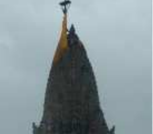
(સૌરાષ્ટ્ર ક્રાંતિ પ્રતિનિધિ-રાજકોટ)

પ્રશાસન દ્વારા સુરક્ષાના ભાગરૂપે દ્વારકાધીશ મંદિરે અડધી કાઠીએ ધજા ચડાવવામાં આવી હતી. નોંધનિય છે કે, મંદિર શિખર પર દરરોજ પાંચ પર ગજની ધજા ચડાવવામાં આવે છે. પરંતુ આજે અવિરત વરસાદને પગલે અડધી કાઠીએ ધજા ચડાવવામાં આવી હતી. તંત્રની સલાહને લઈને નિર્ણય લેવામાં આવ્યો હોવાનું સામે આવ્યું છે. નોંધનિય છે કે, એક વર્ષ અગાઉ તોડતે વાવાઝોડામાં દ્વારકાધીશ મંદિરે અડધી કાઠીએ ધજા ચડાવવામાં આવી હતી. ત્યારબાદ આજે ફરી વખત દ્વારકાધીશ મંદિર પર અડધી કાઠીએ ધજા ચડાવવામાં આવી છે.