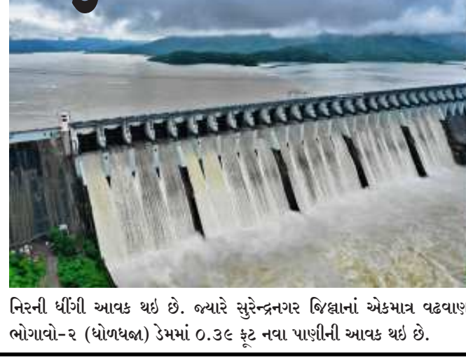
નિરની ધીંગી આવક થઈ છે. જ્યારે સુરેન્દ્રનગર જિલ્લામાં એકમાત્ર વઢવાણ ભોગાવો-૨ (ધોળધબા) ડેમમાં ૦.૩૯ ફૂટ નવા પાણીની આવક થઈ છે.