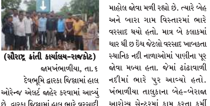
(સૌરાષ્ટ્ર ક્રાંતિ કાર્યાલય-રાજકોટ) ભાખંભાળીયા, તા. ૬ દેવભૂમિ દ્વારા કાચામાં હાલ ઓરેન્જ એલર્ટ બંધેર કરવામાં આવ્યું છે. દ્વારા કાચામાં હાલ ભારે વરસાદી

માહોલ બેવા મળી રહ્યો છે. ત્યારે બેહ અને બારા ગામ વિસ્તારમાં ભારે વરસાદ થયો હતો. માત્ર બે કલાકમાં ચાર થી છ ઈંચ જેટલો વરસાદ ખાખકતા સ્થાનિક નદી નાળાઓમાં પાણીના પૂર બેવા મળ્યા હતા. જેમાં ઢાંઢાવાળી નદીમાં ભારે પુર આવ્યો હતો. ખંભાળીયા તાલુકાના બેહ-બેરાબ આરોગ્ય સેન્ટરમાં કામ કરતા કર્મી