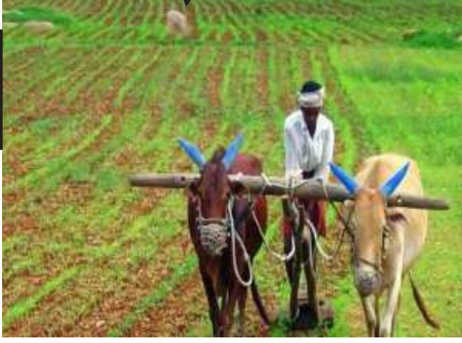
ચાર્ડમાં કપાસના ભાવ બે સમાહથી આંશિક ઘટાડાનું વલણ છે અને ગત ૨૨ જૂન સુધી પ્રતિ મણના રૂમ. ૨૫૦૦ને પાર રહેલા ભાવ કમશઃ ઘટીને આજે રૂમ. ૨૨૧૨ના ભાવે સોદા થયા હતા.

કેન્દ્રી સૌરાષ્ટ્રના ૧૧ જિલ્લાઓમાં વાવેતર થયું છે. એકમાત્ર કપાસનું વાવેતર ગત વર્ષના જેટલું થઈ રહ્યું છે જ્યારે મગફળી સહિત અન્ય તમામ પાકોનું વાવેતર ગત વર્ષ કરતા ઓછું છે. ગત વર્ષે ૪ જૂન સુધીમાં રાજ્યમાં કુલ ૪૦.૫૭ લાખ હે.માં વાવેતર થઈ ગયું હતું, વર્ષે તેની સામે ૩૦.૨૦ લાખ હેક્ટરમાં એટલે કે ૧૦.૨૩ લાખ હેક્ટરમાં વાવેતર ઓછું છે. આમ, મોટાભાગના ખેડૂતો