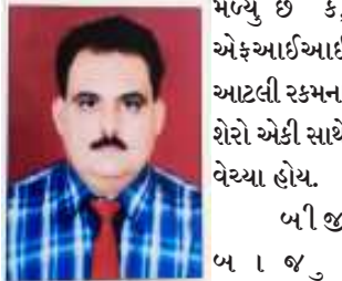
(સૌરાષ્ટ્ર ક્રાંતિ કાર્યાલય-રાજકોટ)

ભાવનું છે કે, એકઆઈઆઈ આટલી રકમના શેરો એકી સાથે વેચ્યા હોય. બીજા મોંઘવારીને કારણે વ્યાજદરોમાં થઈ રહેલો વધારો પણ બજારના ઘટચાનું કારણ છે, ફૂડ ઓઈલમાં પણ સતત તેજ થતાં પેટ્રોલ-ડિઝલના ભાવો વધવાની શક્યતા પણ બજારમાં ભેવાઈ રહી છે. એક.વા.૨.૩ના પ્રથમ ક્વાર્ટરના પરિણામો પણ નબળા આવાશે અથવા તો ધાર્યાં હોય તેટલા સારા નહીં હોય. રશિયા-યુક્રેન વિવાદ પણ ખુબ લાંબો ચાલ્યો છે. જેના