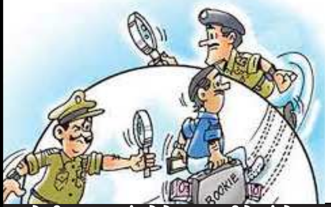
પોલીસ માત્ર પંટરોને જ પકડીને સંતોષ માનવાનું બંધ કરી બુકીઓના નામ ખોલી રહી છે પણ તેના કોલર સુધી હાથ પહોંચે તે જરૂરી