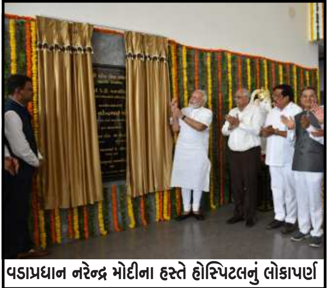
વડાપ્રધાન નરેન્દ્ર મોદીના હસ્તે હોસ્પિટલનું લોકાર્પણ