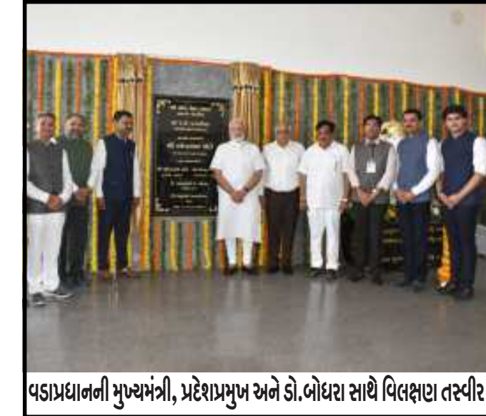
વડાપ્રધાનની મુખ્યમંત્રી, પ્રદેશપ્રમુખ અને ડો.બોધરા સાથે વિલક્ષણ તસ્વીર