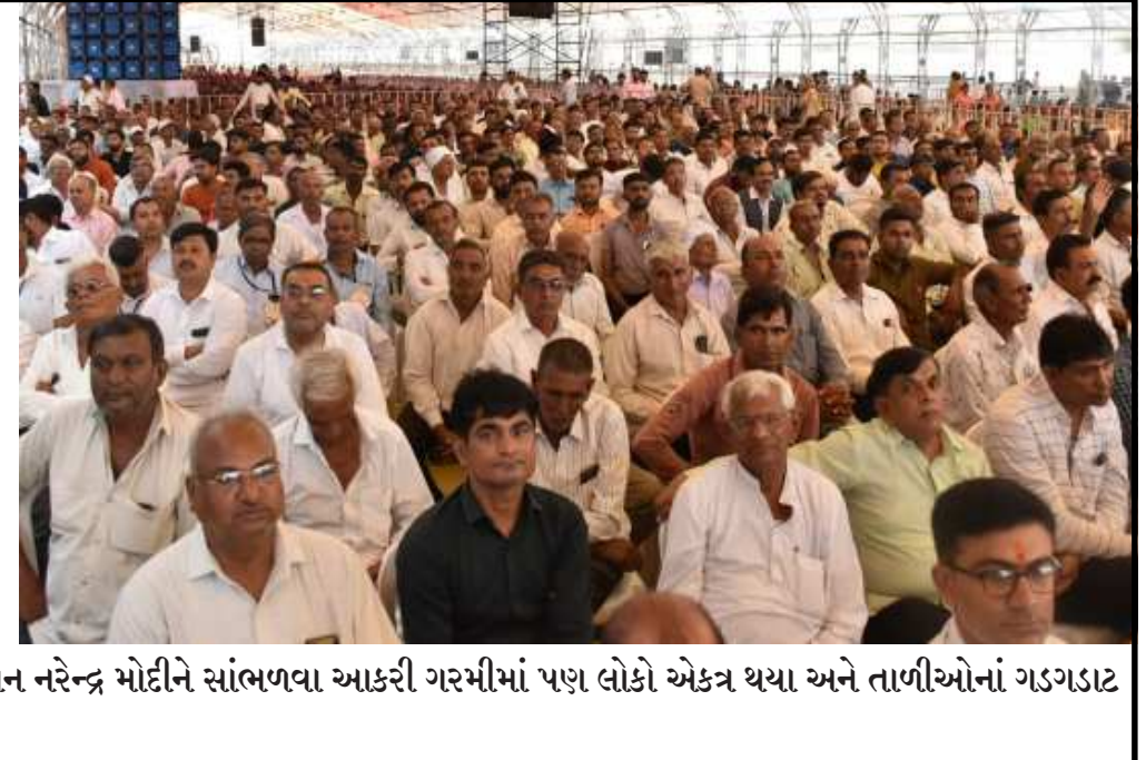
આટકોટમાં હોસ્પિટલનાં લોકાર્પણમાં ઉમટી પડેલી પ્રચંડ જનમેદનીની તસ્વીર વડાપ્રધાન નરેન્દ્ર મોદીને સાંભળવા આકરી ગરમીમાં પણ લોકો એકત્ર થયા અને તાળીઓનાં ગડગડાટ તથા હર્ષનાદોથી વડાપ્રધાનને વધાવી લીધા એ દર્શાય છે.