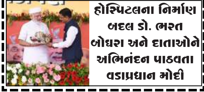
હોસ્પિટલના નિર્માણ બદલ ડો. ભરત બોધરા અને દાતાઓને અભિનંદન પાઠવતા વડાપ્રધાન મોદી

ડોક્ટર થવા માટે માતૃભાષામાં અભ્યાસ કરીને પણ ભણી શકાય તેવો નિયમ બદલ્યો આ માટીના સંસ્કાર છે કે જેને ૮ વર્ષમાં ભૂલ થી પણ કાંઈ ખોટું નથી કર્યું કે જેના કારણે દેશને નીચું જોવું પડે