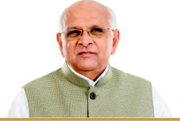
શ્રી ભૂપેન્દ્રભાઈ પટેલ માન. મુખ્યમંત્રી

તારીખ: ૨૮-૦૫-૨૦૨૨ • સમય: બપોરે ૨:૦૦ વાગે સ્થળ: મહાત્મા મંદિર, ગાંધીનગર