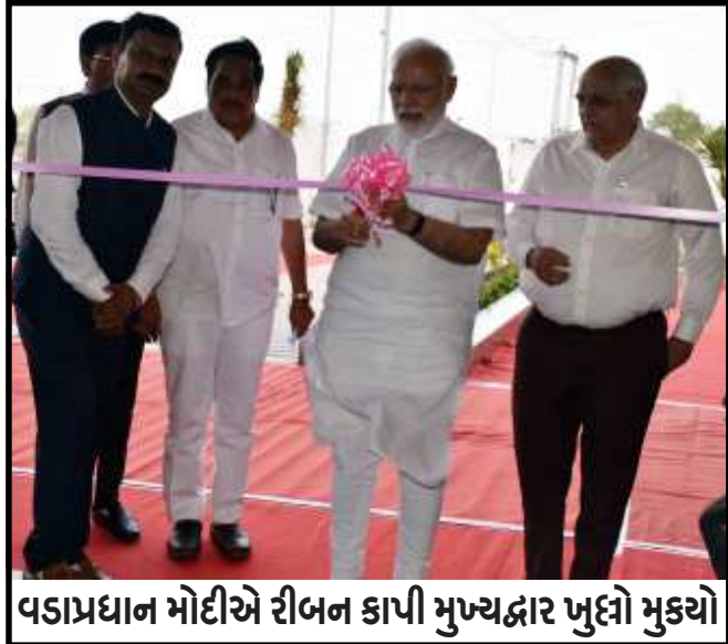
વડાપ્રધાન મોદીએ રીબન કાપી મુખ્યદ્વાર ખુલ્લો મુક્યો

જનકલ્યાણકારી યોજનાઓ અમલમાં મુકવામાં આવી છે. ૮ વર્ષ દરમિયાન મેં રાજ્ગી સેવા કરવામાં કોઈ કસર છોડી નથી. તેમણે કહ્યું હતું કે, આરોગ્યની સેવાઓની સ્થિતિ અત્યંત કંગાળ હતી. ગુજરાતમાં માત્ર ૬ મેડીકલ કોલેજો હતી. માત્ર ૧૧૦૦ બેટલી એમબીબીએસ બેઠકો હતી. ગરીબ પરિવારનાં દીકરાને ડોક્ટર બનવાનું સપનું પૂરું થઈ રહ્યું છે. ડોક્ટર બનવાનું સપનું માત્ર સપનું જ બની રહેતું હતું. એટલે અમારી સરકારે આરોગ્ય ક્ષેત્રે વિકાસને એટલો વેગ આપ્યો છે કે, આજે એકલા ગુજરાતમાં ૩૦ મેડીકલ કોલેજ છે. ૮ હજાર બેટલી મેડીકલ બેઠકો થઈ છે. એનડીએ સરકારે દેશ અને ગુજરાતનાં વિકાસને નવી ગતિ આપી છે. અમે ખૂબ બાપુ અને ખૂબ