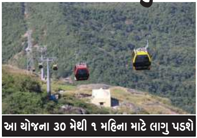
આ યોજના ૩૦ મેથી ૧ મહિના માટે લાગુ પડશે

(સૌરાષ્ટ્ર ક્રાંતિ કાર્યાલય-રાજકોટ) જૂનાગઢ, તા.૨૮ ગુજરાતના જૂનાગઢ જિલ્લામાં ગિરનાર પર્વત આવેલો છે. આ ગિરનાર પર્વતની મુસાફરી ઉંચા બ્રેકો સંચાલિત ઉડાન ટોલોલા (રોપ-વે) દ્વારા કરવામાં આવે છે. તત્કાલમાં આ રોપ-વેની મુસાફરીને અનુલક્ષીને અનોખી યોજના લાગુ કરાઈ છે. IPLની ફાઈનલમાં ગુજરાત ટાઈટન્સની ટીમ પહોંચી છે. રાજ્યભરમાં આ સીઝનનો ઉત્સાહ પૂરબેશમાં ભેવા મળ્યો છે. ત્યારે રોપ-વે દ્વારા ક્રિકેટની મેચને લઈને અનોખી યોજના બહાર પાડવામાં આવી છે. આ યોજના મુજબ બે ગુજરાત ટાઈટન્સ IPL ટાઈટલ જીતે તો બેકોઈ પણ સ્ટેડિયમમાં માન્ય ટિકિટ સાથે બેસી IPL ભેવા ગયા હશે તે ટિકિટ ધારકો ટિકિટ બતાવી ગિરનાર રોપ-વે દ્વારા ફિમાં રોપ-વેની સફર કરાવવામાં આવશે. ગિરનાર રોપ-વે દ્વારા આ યોજના ૩૦ મેથી શરૂ (અનુ.પાના નં.૪ ઉપર)