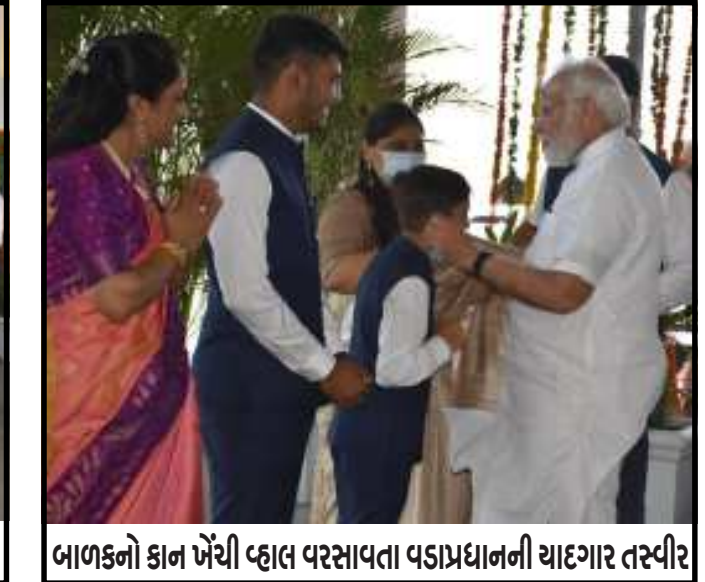
બાળકનો કાન ખેંચી વ્હાલ વરસાવતા વડાપ્રધાનની યાદગાર તસ્વીર