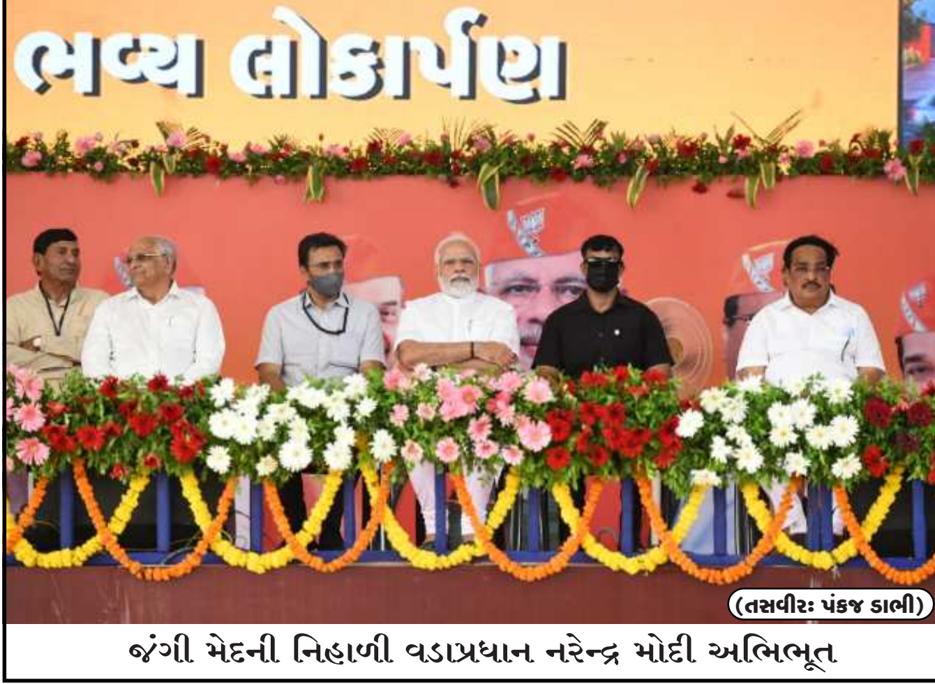
જંગી મેદની નિહાળી વડાપ્રધાન નરેન્દ્ર મોદી અભિભૂત