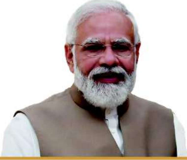
શ્રી નરેન્દ્રભાઈ મોદી માન. વડાપ્રધાન