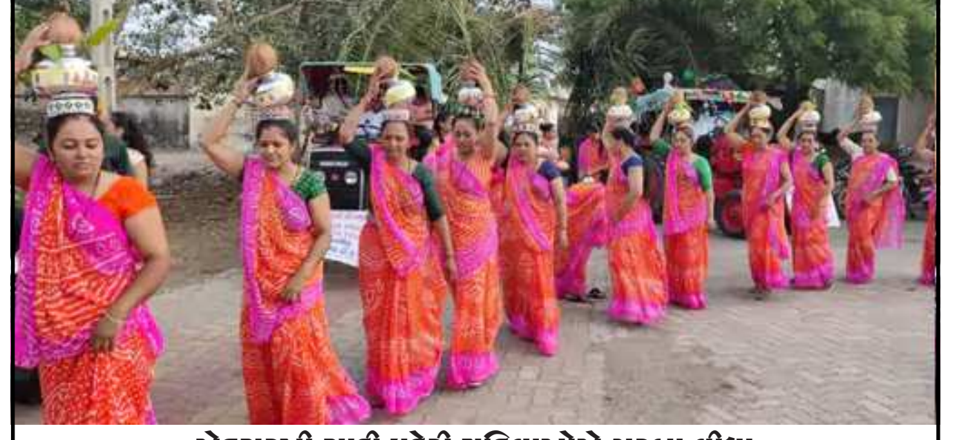
એકસરખી સાડી પહેરી મહિલાઓએ ગરબા લીધા