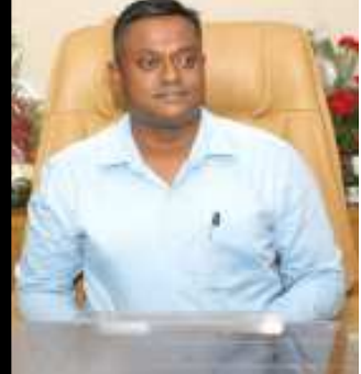
(સૌરાષ્ટ્ર ક્રાંતિ કાર્યલેખ-રાજકોટ)

એકની દરખાસ્ત સરકારમાં મુકાઈ: એક કેમ બામણબોર પાસે તો બીજો કેમ આજુકેમથી આગળ બનાવવા અંગે દરખાસ્ત કરવાની તૈયારી