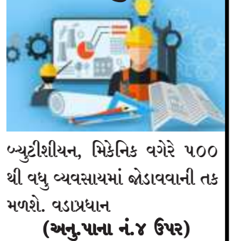
મ્યુટીશીયન, મિકેનિક વગેરે ૫૦૦ થી વધુ વ્યવસાયમાં બોડાવવાની તક મળશે. વડાપ્રધાન (અનુ.પાના નં.૪ ઉપર)

આ ઇવેન્ટમાં ઉર્બી, રીટેઈલ, ટેલીકોમ, આઈટી, ઈલેક્ટ્રોનિક્સ, ઓટો અને ૩૦ થી વધુ ક્ષેત્રોમાં કાર્યસ્ત્ર દેશની ચાર હજારથી વધુ સંસ્થાઓ સહભાગી બની રહી છે. મહત્વકાક્ષી યુવાનોને વેલ્ડર, ઈલેક્ટ્રીશીયન, હાઉસ કીપર,