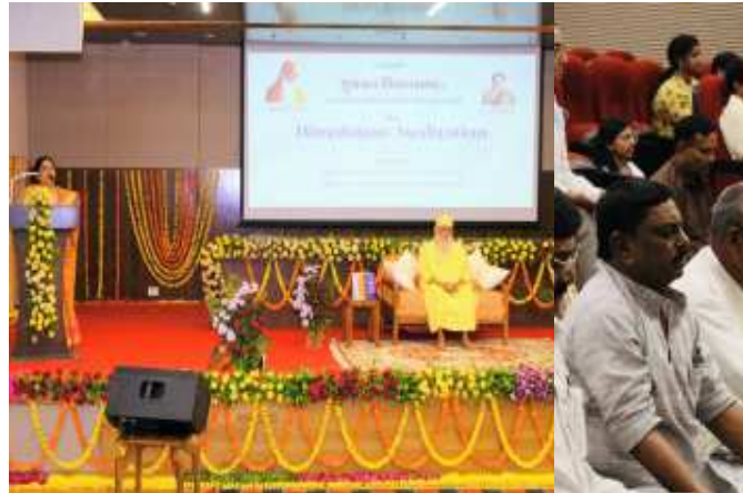
(સૌરાષ્ટ્ર ક્રાંતિ કાર્યાલય-રાજકોટ) ગુજરાત વિધાનસભા ખાતે ગ. વા. માવળંકર દ્વારા સમર્પણ ધ્યાન યોજના પ્રણેતા હિમાલયના મહર્ષિ શ્રી સ્વામી શિવકૃપાનંદજીના સાનિધ્યમાં ધ્યાન શિબિરનું આયોજન તા. ૧૮, ૧૯ અને ૨૦મી એપ્રિલ-૨૦૨૨ દરમિયાન અધ્યક્ષ ડૉ. નીમાબેન આચાર્ય દ્વારા કરવામાં આવ્યું હતું. વ્યકિત અને સમાજની ઉન્નતિ માટે ધ્યાન એક સશક્ત માધ્યમ છે. ગુજરાતની જનતાનું પ્રતિનિધિત્વ કરતા સભ્યો મહત્વની જવાબદારી નિભાવી

બેડાયા હતા અને ખૂબ જ ઉત્સાહ અને ધ્યાનપૂર્વક પૂજ્ય સ્વામિજીના પ્રવચનનો લાભ લીધો હતો અને માર્ગદર્શન મેળવ્યું હતું. સમર્પણ ધ્યાનયોગના પ્રણેતા પૂજ્ય સ્વામીજીએ આત્મજ્ઞાનના પ્રસાર થકી વસુધૈવ કુટુંબમની ભાવના સાકાર થાય, મનુષ્યધર્મ ઉભાગર થાય એ માટે છેલા ૨૫ વર્ષથી ૫૦ થી વધુ દેશોમાં નિઃશુલ્ક સેવાઓ આપી પ્રયાસો આદર્યા છે. આજના સમયમાં વૈચારિક પ્રદૂષણ અને તનાવભર્યા વાતાવરણમાં માનસિક, શારીરિક અને આધ્યાત્મિક શિથિ મેળવવાના પ્રયાસરૂપે ગુજરાત વિધાનસભાના અધ્યક્ષ ડૉ. નીમાબેન આચાર્યએ આ ધ્યાન શિબિરનું આયોજન મંત્રીઓ, ધારો. તેઓના આ પ્રયાસને જબરજસ્ત પ્રતિસાદ સાંપડેલ છે. રહમ છે, ત્યારે આ ધ્યાન શિબિરમાં સર્વે મંત્રીઓના સભ્યો તેમજ ધારાસભ્યોને પણ નિમંત્રણ પાઠવવામાં આવેલ છે. આ ધ્યાન શિબિરમાં અધ્યક્ષ ડૉ. નીમાબેન આચાર્યની સાથે મંત્રીઓ, ધારાસભ્યો તેમજ વિધાનસભા પરિવારના કર્મચારીઓ, અધિકારીઓ