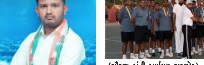
(સૌરાષ્ટ્ર ક્રાંતિ કાર્યાલય-રાજકોટ) રાજકોટ, તા. ૨૧ તાજેતરમાં ભનમગરની સૈનિક સ્કૂલ બાલાચડીમાં શૈક્ષણિક સર ૨૦૨૨-૨૩ માટેની ઇન્ટર હાઉસ બાસ્કેટબોલ ચેમ્પિયનશીપનું આયોજન કરવામાં આવ્યું હતું. આ ચેમ્પિયનશીપમાં છ સિનિયર હાઉસની ટીમોએ ભાગ લીધો હતો. તેમાં તમામ ટીમોને બે પૂલમાં વહેંચવામાં આવી હતી. પૂલ 'એ' માં ગૃહ હાઉસ પ્રતાપ હાઉસ અને સરદાર પટેલ હાઉસનો સમાવેશ કરવામાં