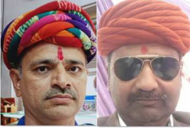
(સૌરાષ્ટ્ર ક્રાંતિ કાર્યાલય-રાજકોટ) કાળજાળ મોંઘવારીનાં મુદ્દે લોકસંસદ વિચારમંચ દ્વારા આવતીકાલે