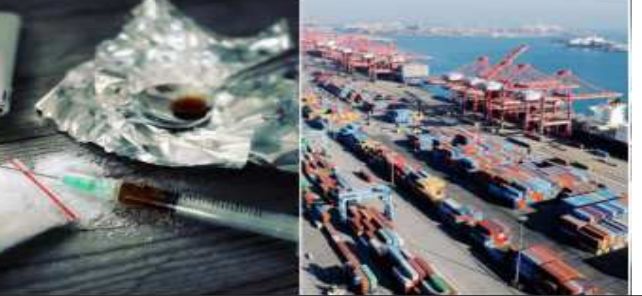
અગાઉ પણ મુન્દ્રા બંદરેથી વિક્રમ સર્જક જથ્થામાં નશીલા પદાર્થોનો જથ્થો ઝડપાયો હતો: અફઘાની અને પાકિસ્તાની ડ્રગ માફિયા ટોળકીઓ દ્વારા કરચનાં સાગર કાંઠાનો ડ્રગ્સની હેરફેર માટે ઉપયોગ: દરિયામાં વધુ સઘન પેટ્રોલિંગની આવશ્યકતા

ગુજરાત એટીએસ અને ડીઆરઆઈની જબરદસ્ત કાર્યવાહી: ગુજરાતનાં કાંઠાનો ડ્રગ માફિયાઓ સતત દૂરઉપયોગ કરી રહ્યાનો વધુ એક ચોકાવનારો ઘડાડો