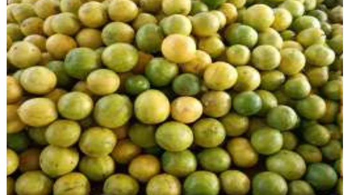
(સૌરાષ્ટ્ર ક્રાંતિ કાર્યલેખ-રાજકોટ)

મહારાષ્ટ્ર-મદ્રાસની આવક વધી, હજુ પણ ભાવ ઘટવાની શક્યતા