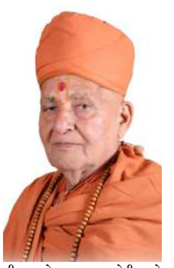
શ્રી ૧૫ મે દરમિયાન છારોડી ખાતે યુવા સંમેલન તથા તા. ૧૭મે થી ૨૨ મે દરમિયાન છારોડી ગુરૂકુલ ખાતે બાલ શિબિરનું આયોજન કરવામાં આવ્યું છે.