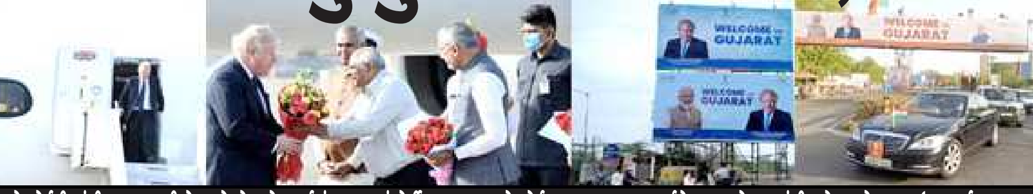
એરપોર્ટથી ગાંધી આશ્રમ સુધી રોડ-શો યોજાયો, માર્ગમાં સ્વાગતનાં હોર્ડિંગ લગાડાયા: એરપોર્ટ પર રાજ્યપાલ આચાર્ય દેવવ્રત અને મુખ્યમંત્રી ભુપેન્દ્ર પટેલ દ્વારા ઉષ્માભર્યું સ્વાગત

(સૌરાષ્ટ્ર ક્રાંતી કમ્પોઝિંગ-રાજકોટ) અમદાવાદ, તા.૨૧ બ્રિટનનાં વડાપ્રધાન આર્ચે ગુજરાતની યાત્રાએ આવી પહોંચ્યા છે. અમદાવાદ એરપોર્ટ પર વડાપ્રધાન બોરિસ જોહનસનનું ભવ્ય અને ઉત્સાહભર્યું સ્વાગત કરવામાં આવ્યું હતું. રાજ્યપાલ આચાર્ય દેવવ્રત અને મુખ્યમંત્રી ભુપેન્દ્ર પટેલે જોહનસનને ઉષ્માભર્યાં આવકાર આપ્યો હતો.