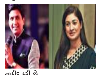
ચંદીગઢ, તા. ૨૧

આપ નાં રાષ્ટ્રીય નેતા અને દિલ્હીનાં મુખ્યમંત્રી અરવિંદ કેજરીવાલ સામે ખાલિસ્તાની સંપર્કનાં ખોટા આક્ષેપો અને નિવેદનો કરવા બદલ પંજાબ પોલીસે અત્યાચાર નાં એક કસ્ટમરનાં નેતા અને બાણીતા કવિ કુમાર વિશ્વાસ તથા અલ્કા લાંબા વિરુદ્ધ એક્ઝાઈબીટર દાખલ કરી છે. અલ્કા લાંબા કોંગ્રેસનાં નેતા છે. બંને નેતાઓને પંજાબ પોલીસે નોટીસ પણ ફટકારી છે. ૪૮ કલાકમાં તપાસ માટે હાજર થવા પોલીસે વિશ્વાસ અને લાંબાને