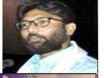
(અનુ.પાના નં.૪ ઉપર)

લાજકારી આપી હતી અને જણાવ્યું હતું કે, ગઈ મોડીરાતે આસામ પોલીસે પાલનપુરમાં સર્કિટ હાઉસમાંથી મેવાણીની ધરપકડ કરી લીધી હતી. બે કે મેવાણી સામે થઈ