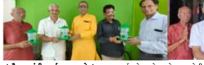
(સૌરાષ્ટ્ર ક્રાંતિ કાર્યાલય-રાજકોટ) શ્રી જલારામ ગૌશાળા (ભાભર, બિજો બનાસકાંઠા)એ માંદી ગાયોની સારવાર ઓપરેશનો અને નિભાવ કરતી ગુજરાતની સૌથી મોટી ડો હોસ્પિટલ તથા ગૌશાળા છે. જ્યાં હાલ લગભગ ૧૧૦૦૦ જેટલી ગાયોની સારવાર તથા નિભાવ થઈ રહ્યો છે. ગૌ માતાઓની દેવભાવથી સેવા, સુશુષ્કા, બનાસકાંઠા જીલ્લાના અંતરીયાળ ભાભર ગામમાં આવેલ શ્રી જલારામ ગૌશાળા ની સ્થાપના આજથી

સદ્ભાવના વૃદ્ધાશ્રમ અને એનિમલ હેલ્પલાઇનની કામગીરી નિહાળીને કરી વિશેષ ચર્ચા