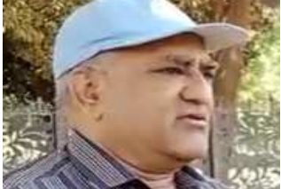
(સૌરાષ્ટ્ર ક્રાંતિ પ્રતિનિધિ-રાજકોટ)

૩ દિવસમાં ખુલાસો આપવો પડશે: સંતોષકારક જવાબ આપવામાં નહીં આવે તો શિક્ષકો વિરૂદ્ધ દંડાત્મક કાર્યવાહી