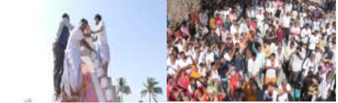
(સૌરાષ્ટ્ર ક્રાંતિ કાર્યાલય-રાજકોટ) પ્રતિષ્ઠા મહોત્સવની ભાવભેર ઉજવણી કરવામાં આવી હતી. ગત તા. ૧૭ના રોજ પૂજા પ્રારંભ, શોભા યાત્રા, જલાધીવાસ કાર્યક્રમ, રાત્રીના કાન ગોપી કાર્યક્રમ

નવનિર્મિત શ્રી સૂર્યમુખી હનુમાનજી મંદિરે ધાર્મિક ઉત્સવમાં ભાવિકો ઉમટયા