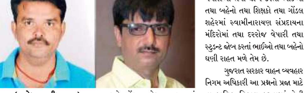
(જીજ્ઞેશ વાગડીયા દ્વારા) રાજકોટ, તા.૨ ગોંડલ-સુરત, ગોંડલ-ગોધરા, ગોંડલ-અમદાવાદ, ગોંડલ-બરોડા, ગોંડલ-નાસિક, ગોંડલ-ઉદયપુર, ગોંડલ-નાથદ્રારા વગેરે લાંબા રૂટની બસો પરત ફર્યા ત્યારે રાજકોટ શહેરમાં તેમનું છેલ્લું મોટું સ્ટેશન હોય છે. આ સ્ટેશન ધડી

માત્ર ૫-૧૦ મુસાફરો બાકી રહેતા હોવાથી અન્ય લોકોને લોકલ ભાડાથી બેસવા દેવા માંગણી