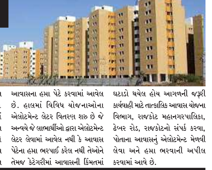
આવાસના હસા પેટે કરવામાં આવેલ છે. આજ રીતે તા.૦૧/૦૪/૨૦૨૧ થી તા.૩૧/૦૩/૨૦૨૨ સુધીમાં આવાસ યોજના વિભાગ દ્વારા ૩,૧૫૪,૧૪,૪૦,૬૭૪ (એકસો ચોપન કરોડ ચૌદ લાખ સુડતાલીસ હજાર છસો ચીમોતેર પુરા)ની વસુલાત આવાસના હસા પેટે કરવામાં આવેલ છે. હાલમાં વિવિધ યોજનાઓના એલોટમેન્ટ લેટર વિતરણ શરૂ છે જે અન્યથે લાભાર્થીઓ દ્વારા એલોટમેન્ટ લેટર લેવામાં આવેલ નથી કે આવાસ પેટેના હસા ભરપાઈ કરેલ નથી તેઓને તેમજ કેટેગરીમાં આવાસની કિંમતમાં ઘટાડો થયેલ હોય આગળની જરૂરી કાર્યવાહી માટે તાત્કાલિક આવાસ યોજના વિભાગ, રાજકોટ મહાનગરપાલિકા, ડેવલપર રોડ, રાજકોટનો સંપર્ક કરવા, પોતાના આવાસનું એલોટમેન્ટ મેળવી લેવા અને હસા ભરવાની અપીલ કરવામાં આવે છે.

(સૌરાષ્ટ્ર ક્રાંતી કાર્યાલય-રાજકોટ) રાજકોટ,તા.૨ રાજકોટ મહાનગરપાલિકા દ્વારા અલગ અલગ યોજનાઓ અંતર્ગત આવાસ સુધીમાં ૩૧,૦૦૦થી વધારે આવાસ બનાવીને લાભાર્થીઓને ફાળવવામાં આવેલ છે. જેમાં પ્રધાનમંત્રી આવાસ યોજના, સ્માર્ટ ઘર, મુખ્યમંત્રી આવાસ યોજના, BSUP - 1,2,3, રાજ્ય આવાસ યોજના, ગુરુજીનગર, ધરમનગર, ૩૦૧૨, હુડકો, વામ્બે અને સફાઈ કામદાર આવાસ યોજનાઓનો સમાવેશ થાય છે. આવાસ યોજના વિભાગ દ્વારા તા.૦૧/૦૩/૨૦૨૨ થી તા.૩૧/૦૩/૨૦૨૨ સુધીમાં ૩,૧૩,૮૨,૩૯,૭૦૨(તેર કરોડ બ્યાસી લાખ ઓગણ ચાલીસ હજાર સાતસો બે પુરા)ની આવક કરેલી છે. તા.૨૩/૦૬/૨૦૨૧ થી તા.૩૧/૦૩/૨૦૨૨ સુધીમાં ૩,૧૨૩,૬૩,૨૪,૯૫૦ (એકસો ત્રેવીસ કરોડ ત્રેસ લાખ ચોવીસ હજાર નવસો પચાસ પુરા) ની વસુલાત