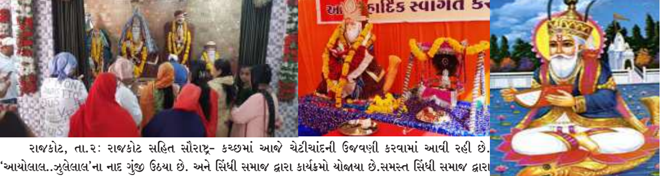
રાજકોટ, તા.૨: રાજકોટ સહિત સૌરાષ્ટ્ર- કચ્છમાં આજે ચેટીયાંદની ઉજવણી કરવામાં આવી રહી છે. 'આયોલાલ...જુલેલાલ'ના નાદ ગુંજ ઉઠ્યા છે. અને સિંધી સમાજ દ્વારા કાર્યક્રમો યોજાયા છે.સમસ્ત સિંધી સમાજ દ્વારા અડધો દિવસ ધંધા-રોજગાર ધંધ રાખીને જુલેલાલ જયંતિ મહોત્સવમાં બેઠાયા હતા.