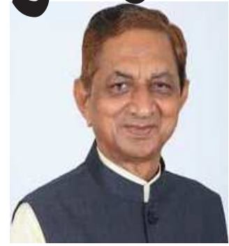
ચૂંટણીઓ કરવા ચઢાણ જેવી બની રહેશે. આદિવાસી નેતાઓમાં પણ આપ ને સમર્થન આપવાનું વલણ દેખાય છે. કેમકે તાપી- પાર- નર્મદા રીવર લીક પ્રોજેક્ટથી આદિવાસી સમાજ ભાજપથી ખૂબ નારાજ દેખાય છે.