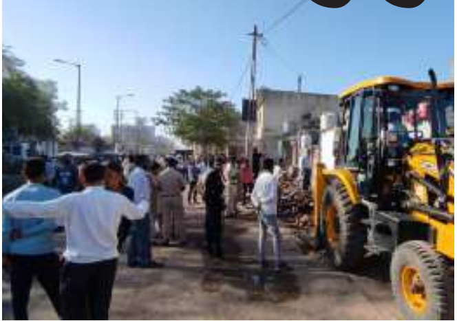
વોર્ડ નં. ૧૮માં દબાણો દૂર કરાયા