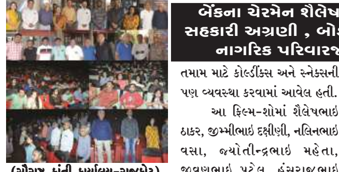
(સૌરાષ્ટ્ર ક્રાંતિ કાર્યાલય-રાજકોટ) રાજકોટ નાગરિક સહકારી બેંક સહકારી અગ્રણી, બોર્ડના સદસ્યો સહિત ૭૨૪ નાગરિક પરિવારજનોએ ફિલ્મ નિહાળી