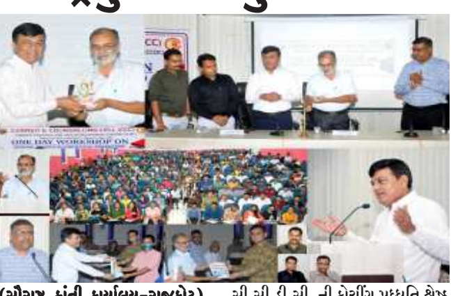
(સૌરાષ્ટ્ર ક્રાંતિ કાર્યાલય-રાજકોટ) રાજકોટ.તા.૩૦ સૌરાષ્ટ્ર યુનિવર્સિટીના કેરિયર કાઉન્સેલિંગ અને ડેવલપમેન્ટ સેન્ટર (સી.સી.ડી.સી.) દ્વારા રાજ્ય અને કેન્દ્ર સરકારની વિવિધ સ્પર્ધાત્મક પરીક્ષાઓની તૈયારી માટે તાલીમપ્રણાલિઓ અને રેઝ્યુમે કોર્સિંગ માસ્કત સફળતા પૂર્વક કરાવવામાં આવે છે. અનેક પરીક્ષાઓમાં સી.સી.ડી.સી.ના છાત્રોએ રેકોર્ડબ્રેક પરિણામો થકી