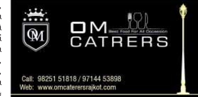
Call: 98251 51818 / 97144 53898 Web: www.omcaterersrajkot.com