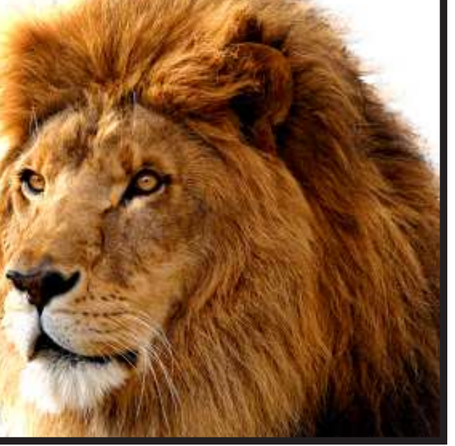
૧૪ કરોડની આવક થઈ હોવાનું પણ સરકારે વિધાનસભામાં જણાવ્યું હતું.