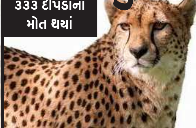
(સૌરાષ્ટ્ર ક્રાંતિ કાર્યાલય-રાજકોટ) અમદાવાદ.તા.૩૦ ગુજરાત વિધાનસભાના સત્રમાં સરકારે માહિતી આપી હતી કે, બે વર્ષમાં ૩૩૩ દીપડાના મૃત્યુ