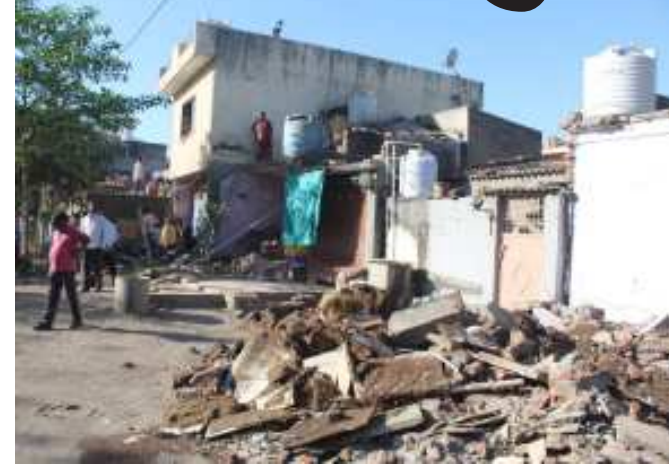
તા. ૨૮/૧૨/૨૦૨૧ થી તમામ દબાણકર્તાઓને ધી ગુજરાત ટાઉન ટાઉનપ્લાનિંગ એન્ડ અર્બન ડેવલોપમેન્ટ એક્ટ-૧૯૭૬ ની કલમ ૬૮ અને તે હેઠળના રૂલ નં. ૩૩ મુજબની નોટીસ આપવામાં આવેલ અને ત્યારબાદ પત્રથી દબાણ દુર કરવા માટે તેમજ સ્થાનિકે વારંવાર રૂબરૂ તમામ દબાણકર્તાઓને જણાવવામાં આવેલ. જેના ભાગરૂપે રાજકોટ મહાનગરપાલિકાની ટાઉન ટાઉનપ્લાનિંગ શાખા દ્વારા આજે વોર્ડ