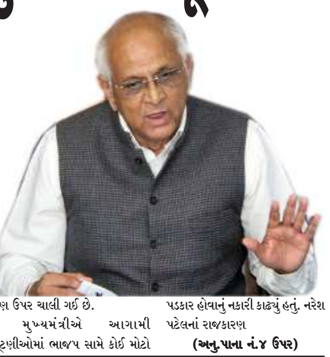
પણ ઉપર ચાલી ગઈ છે. મુખ્યમંત્રીએ આગામી ચૂંટણીઓમાં ભાજપ સામે કોઈ મોટો પડકાર હોવાનું નકારી કાઢ્યું હતું. નરેશ પટેલનાં રાજકારણ (અનુ.પાના નં.૪ ઉપર)

મફત વીજળી અને પાણી પૂરું પાડવાના આપ નાં ચૂંટણી વાયદાઓને વ્યર્થ ગણીને ફગાવી દેતા મુખ્યમંત્રીએ કહ્યું હતું કે બધું મફત આપવું એ કોઈ સમસ્યાનો ઉકેલ નથી. હું પણ આપું કરી શકું છું પણ તેનાથી રાજ્યની નાણાકીય પાથ પર પ્રતિકુળ અસર થઈ શકે છે. તે માટે રાજસ્થાનનો અભ્યાસ કરો. મફત સેવાઓ આપીને રાજસ્થાન નાણાંબાધને બેકાળુ બનાવી દીધી છે અને ૪.૫ ટકાની નિર્ધારિત મર્યાદાથી