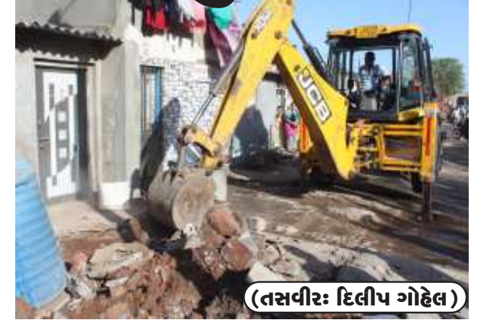
૨,૨૫,૦૦,૦૦૦ની જમીન ખુદી કરાઈ હતી. આ કામગીરીમાં ટાઉન ટાઉનપ્લાનિંગ શાખા, દબાણ હટાવ શાખા, રોશની શાખા, બાંધકામ શાખા તથા ફાયર એન્ડ