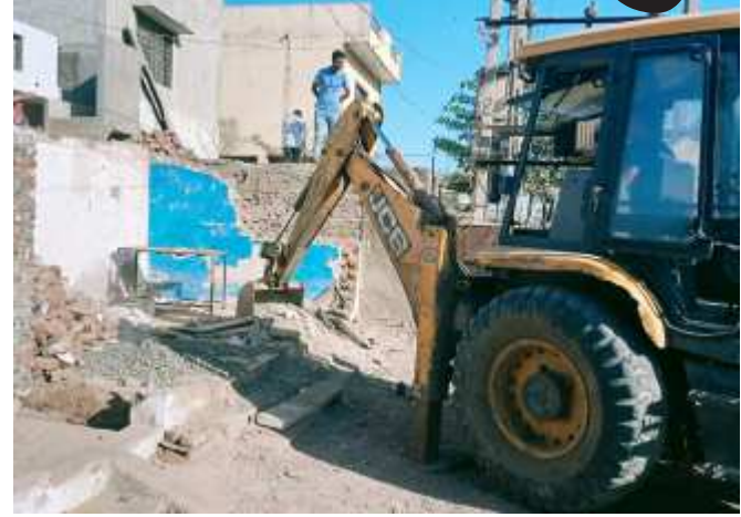
કામગીરી માટે ઉતારવામાં આવે છે. તેજ રીતે ટીપી શાખા દ્વારા સતત બિલા દિવસે ટાઉનપ્લાનિંગ સ્કીમ નં. ૧૨ (કોઠારીયા) કે જે તા. ૧૩/૦૭/૨૦૧૮ ના પ્રારંભિક મંજુર થયેલ જેના અમલીકરણના ભાગરૂપે