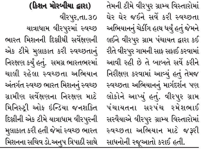
(કિશન મોરબીયા દ્વારા)

સ્વચ્છ ભારત મિશન અંતર્ગત ગ્રામ્ય વિસ્તારોમાં ઘરે-ઘરે જઈને કરાચું નિરીક્ષણ