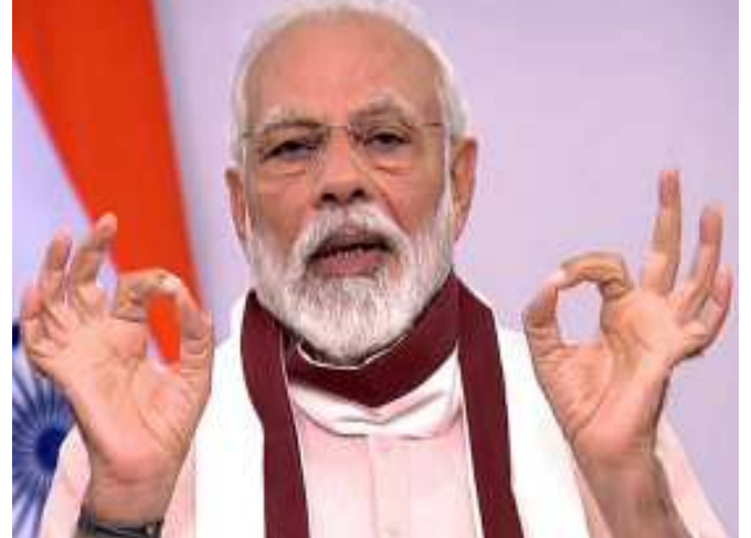
પેકેજ બહેર થયું હતું. ૨૮ જૂન ૨૦૨૧ના રોજ બીજા રાહત પેકેજ હેઠળ ૬.૩ લાખ કરોડનું પેકેજ બહેર થયું હતું.

હરસંભવ પ્રયાસ કરશે. અધિકારીઓનું કહેવું છે કે, ૨૦૨૨નું બજેટ તૈયાર કરતી વખતે એ ધારણા હતી કે બીજી બહેર નહિ આવે પણ એ ધારણા ખોટી સાબિત થઈ અને જુનમાં પેકેજ બહેર કરવું પડ્યું. મનરંગા, આત્મનિર્ભર ભારત રોજગાર યોજના, પ્રધાનમંત્રી ગરીબ કલ્યાણ યોજના અને કીડાયતી ઘરો પર મદદ જેવી યોજનાઓ હતી. એક અન્ય અધિકારીના કહેવા મુજબ આમાંથી કેટલીક યોજનાનો ગાળો લંબાવાશે. સાથે જ મનરંગાને મળતા ફંડને વધારાશે. નાણા મંત્રાલયના જણાવ્યા મુજબ કોરોનાકાળમાં જે ૫ કિલો વર્ક યોજા અને એક કિલો દાળની પ્રતિ માસે ફીમાં આપવાની બહેરારત કરી હતી તેની મુદત માર્ચ ૨૦૨૨માં પુરી થાય છે તો મધ્યમ વર્ગના લોકોને ઘર પરિવહન કેડીટ લીક સબ્સીડી યોજના જે માર્ચ-જૂનના પુરી થાય છે તેને પણ વધારી શકાય તેમ છે. ૨૬ માર્ચ ૨૦૨૦ના રોજ ૧.૭ લાખ કરોડની પ્રધાનમંત્રી ગરીબ કલ્યાણ યોજના બહેર થઈ હતી. ૨૭ માર્ચ ૨૦૨૦ના રોજ રિઝર્વ બેંકે રેપો રેટમાં ૭૫ પોઈન્ટનો ઘટાડો કર્યો હતો. ૩ મહિનાનું મોરેટોરિયમ પણ અપાયું હતું. ૧૬-૧૭ મેના રોજ ૨૦ લાખ કરોડનું પેકેજ બહેર થયું હતું. ૨૮ જૂન ૨૦૨૧ના રોજ બીજા રાહત પેકેજ હેઠળ ૬.૩ લાખ કરોડનું પેકેજ બહેર થયું હતું.