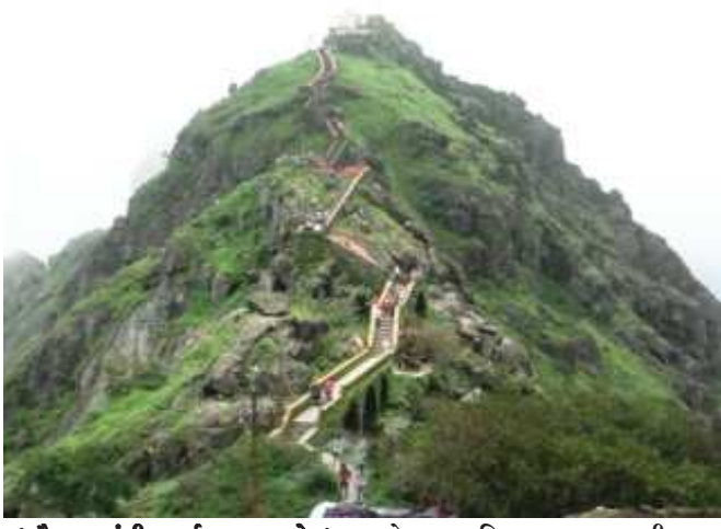
(સૌરાષ્ટ્ર ક્રાંતિ કાર્યાલય-રાજકોટ) રોજ અખિલ ભારત ગીરનાર આરોહણ-અવરોહણ સ્પર્ધા યોજાશે. જેમાં દેશભરના ૪૪૯ સ્પર્ધકો ભાગ લેશે. જૂનાગઢમાં ગત તા. ૬ ફેબ્રુઆરીના રાષ્ટ્રીય કક્ષાની ગિરનાર