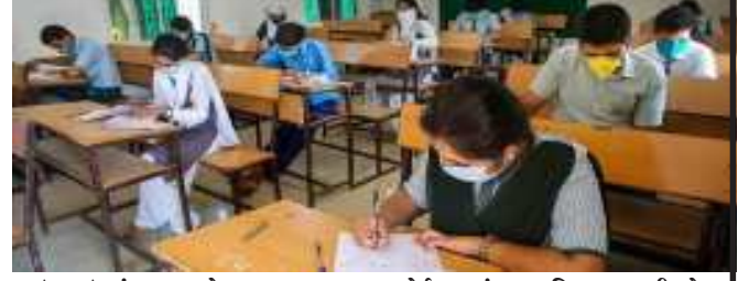
ગાઈડલાઈનનું ચૂસ્તપણે પાલન તમામ શાળાઓએ કરવાનું રહેશે તેમ ગુજરાત માધ્યમિક અને ઉચ્ચતર માધ્યમિક શિક્ષણ બોર્ડના સંયુક્ત નિયામક બી.એન. રાજગોરે રાજ્યના તમામ શિક્ષણાધિકારીઓને જણાવ્યું છે.

દરમિયાન શાળા કક્ષાએ ઓફલાઈન પદ્ધતિએ લેવાનું બહેર કરાયું છે. શાળા કક્ષાએ ઓફલાઈન પદ્ધતિએ લેવાનારી ધો.૯થી ધો.૧૨ની પ્રિલિમ કે દ્વિતીય પરીક્ષા તા.૧૦ ફેબ્રુઆરીથી તા.૧૮ ફેબ્રુઆરી દરમિયાન બે કોઈ વિદ્યાર્થી કોરોનાને લીધે બિમાર હોય કે તેના કુટુંબમાં કોઈ વ્યક્તિ બિમાર હોય અથવા તો તે વિદ્યાર્થી કન્ટેન્ટમેન્ટ ઝોનમાંથી આવતો હોય તો તેવા વિદ્યાર્થીઓ માટે શાળા કક્ષાએ અલગથી તારીખ નક્કી કરીને શાળા કક્ષાએથી અલગ પ્રકારનો તૈયાર કરીને પછીથી પરીક્ષા લેવાની સુચના આપવામાં આવી છે. આ ઉપરાંત ધો.૯થી ધો.૧૨ની લેવાનારી પરીક્ષામાં વિદ્યાર્થીઓને સોશિયલ ડિસ્ટન્સ જળાવવા તે મુજબ બેઠક વ્યવસ્થા ગોઠવવાની રહેશે. આ પરીક્ષા દરમિયાન કોરોનાની સરકારની