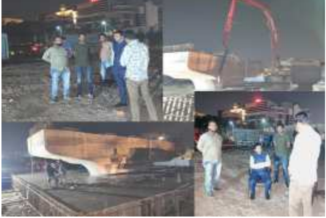
(સૌરાષ્ટ્ર ક્રાંતિ કાર્યાલય-રાજકોટ) મહાનગરપાલિકા દ્વારા શહેરમાં રાજકોટ, તા.૧૮ ટ્રાફિકની સમસ્યા હળવી થાય તેવા હેતુથી જુદા વિસ્તારમાં ૬ સ્થળોએ બ્રિજની કામગીરી ચાલી રહેલ છે. ચાલી રહેલ બ્રિજની કામગીરી સમયમર્યાદા પહેલા પૂર્ણ થાય તે માટે પદાધિકારી દ્વારા અવારનાવર સ્થળ મુલાકાત લેવામાં આવી રહી છે અને બ્રિજની કામગીરી કરતી એજન્સીઓની દિવસ-રાત કામગીરી કરવા જણાવવામાં આવેલ. જેના અનુસંધાને ગઈકાલ તા.૧૭ ના રોજ રાત્રે કાલાવડ રોડ પર જડુડા હોટેલ ખાતે રૂ.૨૯ કરોડના ખર્ચે ચાલી રહેલ ઓવરબ્રિજની કામગીરીની મેયર ડો.પ્રદિપ ડવએ સ્થળ મુલાકાત લીધેલ.(૧.૧૬)