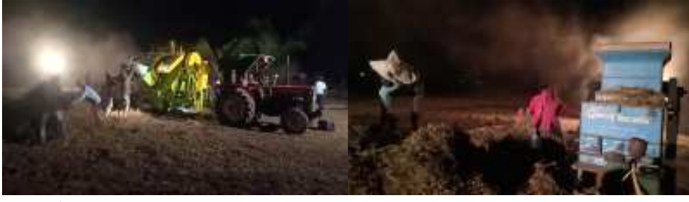
(ગોવિંદ હડિયા દ્વારા) વાતાવરણમાં પલટો આવતા વરસાદી મહાહલ સર્બતા ખેડૂતો મુંઝવણમાં મુકાયા છે ચાર મહીનાની મહેનત બાદ મગફળીનો તૈયાર થયેલ પાક હાથમાંથી જવાની ભીંતીથી ખેડૂતોએ રાત્રીના સમયે ઓપનેર પ્રેશર શરૂ કરી