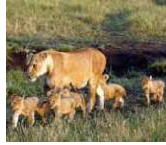
(અમારા પ્રતિનિધિ દ્વારા) જુનાગઢ, તા. ૧૮ જુનાગઢ સક્કરબાગ ઝૂમાં સિંહણે એક બે ત્રણ નહીં પાંચ સિંહ બન્મ આપ્યો હતો.

બાળને જન્મ આપ્યો હતો. ઝૂ સ્ટાફમાં પુશીનો માહોલ ઇવાયો છે. સક્કરબાગ ઝૂમાં રહેતી સિંહણ ડી-૯એ એવન નાના સિંહ સાથે સંવર્ધન કરતા ડી-૯ સિંહણે એક પછી એક પાંચ સિંહ બાળને જન્મ આપ્યો હતો. જેની વેટનરી સ્ટાફ સતત ઈન્ટેન્સિવ રાખી રહ્યા છે. તમામ બચ્ચા-માતાની તબીયત સારી હોવાનું ઝૂ સંચાલકોએ જણાવ્યું છે. અગાઉ પણ આ સિંહણે ૩ વખતને જન્મ આપ્યો હતો.