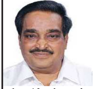
(સૌરાષ્ટ્ર ક્રાંતિ કાર્યાલય-રાજકોટ)

ભાજપનાં મુખ્ય અગેવાનોની બેઠક, પત્રકાર સ્નેહમિલન, એન.જી.ઓ. અને ઉદ્યોગપતિઓ સાથે બેઠક તથા બ્રહ્મસમાજનો જ્ઞાન સંકલ્પ કાર્યક્રમમાં ઉપસ્થિતિ