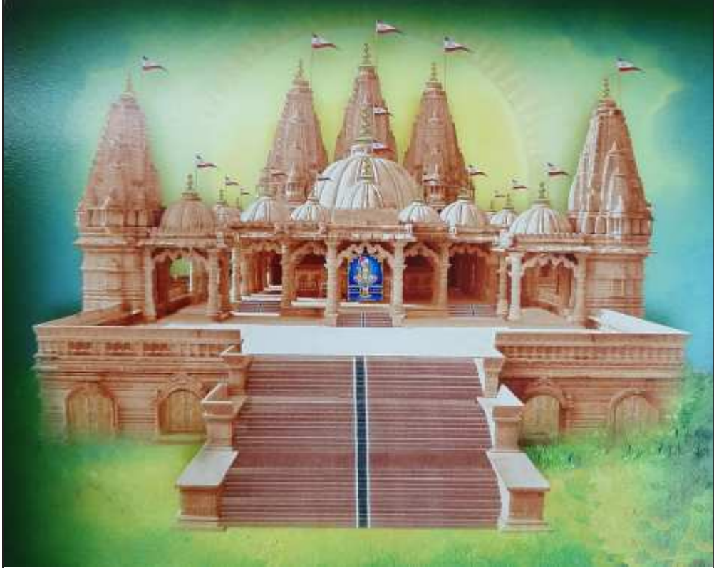
મંદિરમાં ૧૬ ઘુમટ, ૧૦૮ સ્થાંભ, ૧૦૮ કમાન સહિત ભવ્ય મંદિર તૈયાર થયું