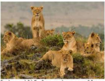
વિભાગે વન્ય જીવોની ટ્રેડિંગ સિસ્ટમ વધુ જાગૃત કરવા આયુર્નિદેશનોલેક્ષ અપનાવી છે. જીવોને સાચાના વાહનો, ઘણા વન્ય પ્રાણીની સારવાર માટે રેક્રમ સેન્ટર અને એનિમલ સેલેક્શન ડેપાર્ટમેન્ટ જેવી સુવિધાઓ સરકારે આપવાની છે.

(સૌરાષ્ટ્ર ક્રાંતિ કાર્યાલય-રાજકોટ) ગુજરાતમાં વન, વન અને દરિયાઈ સુરક્ષા સંરક્ષણ તથા સંવનન માટે નવાર આયોજન સરકારે હાથ ધર્યો છે. એવું દર્શાવતા મુખ્યમંત્રી ભુપેન્દ્ર પટેલે જણાવ્યું હતું કે, ભારતીય સંસ્કૃતિની સહઅસ્થિતિની જીવો અને જીવવા દો'ના સંસ્કારોની ભાવના અને વારસા થકી વન્ય જીવનના રક્ષણ, જનન અને સંવનનને આપણે વધુ સુક્રમ બનાવી રહ્યા છીએ. આ સંદર્ભમાં રાજ્ય સરકાર ગુજરાતની વન વિરાસત, વન જીવોની સુરક્ષા અને દરિયાઈ જીવોની સંરક્ષાની લાભોક્ષીતા ટાળવાની નેમ ધરાવે છે.