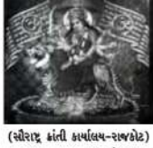
(સૌરાષ્ટ્ર ક્રાંતિ કમ્પ્યુટર-રાજકોટ) રાજકોટ, તા.૯ કોઠારીયા કોલોની ગરબી મંડળ છેલા ૬૪ વર્ષથી પ્રાચીન ગરબીનું