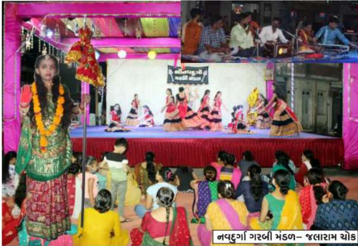
નવદુર્ગા ગરબી મંડળ- જલારામ થોક