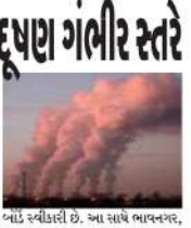
આ સ્તરે હવાની ગુણવત્તા સુધારવા માટે એકઠાન આયતન બનાવવામાં આવ્યા હોવાની સોહાગ-નામા પર સ્વચ્છતા કાર્યાલમાં આવી છે.

(બેજ-બી સમાચાર) ગાંધીનગર, તા.૯ શહેરોમાં હવાની ગુણવત્તા સુધારવા માટે એકઠાન આયતન બનાવવામાં આવ્યા હોવાની સોહાગ-નામા પર સ્વચ્છતા કાર્યાલમાં આવી છે. ૧૫ વર્ષથી હવા વાહનો સ્તના પર યાવવાવા પર રોક લગાવવાનો નિર્ણય લેવામાં આવ્યો છે. ઇન્ડસ્ટ્રીઝમાં કચુઅલ તેરીફ વપસતા કમ્પેન્ટ ઓઈલ અને કોલસાને તબક્કાવાર રીતે ઈમ્પલ તેરીફ ઉપયોગમાં લેવાનું બંધ કરવા માટે સરકાર નિષ્ણાતિ હોવાની સ્વચ્છતા પણ કરવામાં આવી છે.