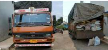
(સૌરાષ્ટ્ર ક્રાંતિ કમ્પ્યુટર-રાજકોટ) રાજકોટ, તા.૯ પોલીસ ઠંડપંચકેટર રૂબેચલ

૧૦ કિ.ગ્રા. નો ૨૦૦ બાથકા ફુલ ૧૦ હજાર કિ.ગ્રા. ઘઉંનો જથ્થો રાજકોટ જાણતા કબ્જે કરી આટલો પોલીસ સ્ટેશનમાં રાખેલ, માલખાતર જલસુ, નાથન શિલા પેનેજર, ગોડાઉન મેનેજર જલસુ, રાજકોટ પુરવઠા ટીમ, પોલીસ ડેપુટી-સુપર, રાજકોટ ઓપરેશન ડ્યુપ્લિ રાજકોટ ગ્રામ્ય દ્વારા તપાસ કરવામાં આવતા વિગતો જાહેર કરવામાં આવી છે. ઘઉંનો જથ્થો બહાર વિતરણ વ્યવસ્થાકોટનો પ્રાથમિક રીતે કે નિવન ખાતેથી પીળા કલરનાં ટોરાથી સમભરતી કરેલા ખાતરના ભેગા મળ્યા નથી. આઈસર વાહન નં. ૭૭૭ ૦૩ એટી ૧૦૩૩ નો ડ્રાઈવર મુકુભાઈ ૨ પુભાઈ મી. દ્વારા કોઈ ખરીદ-વેચવામાં કોઈ આધાર પુરાવાઓ રજૂ કરવામાં આવેલ ન હોવાથી ઘઉંનો બાથકા ૫૦ કિલોનાં ૨૦૦ ફુલ ૧૦ હજાર કિ.ગ્રા. જેની ઉંચત એક લાખ પેંચાણું હજાર અને આઈસર વાહન ૧ જેની ઉંચત ૩ લાખ પેંચાણું હજારનો મુદામાલ સીઝ કરવામાં આવ્યો હોવાનું જણાયું છે.(૧.૧૨)