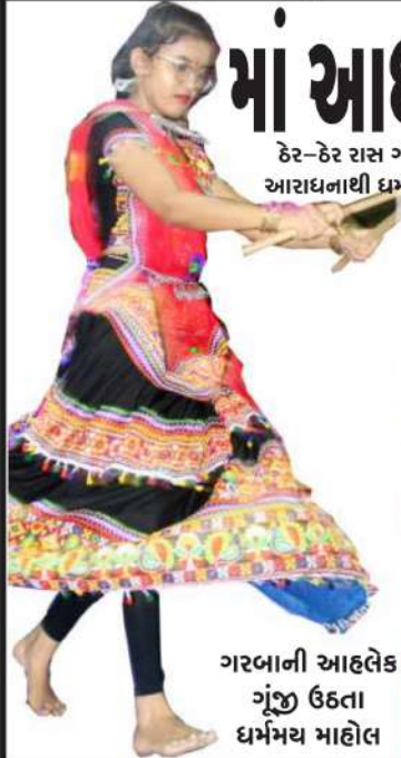
ગરબાની આહલેક ગુંજી ઉઠતા ધર્મમય માહોલ

ઠેર-ઠેર રાસ ગરબાની રમઝટ મચી: શૈલપુત્રીની આરાધનાથી ધર્મમય બનતી શહેરની શેરી-ગલીઓ