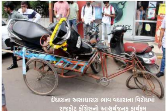
ઈંધણાના અસાધારણ ભાવ વધારાના વિરોધમાં રાજકોટ કોંગ્રેસની આયોજિત કાર્યક્રમ