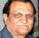
(સૌરાષ્ટ્ર ક્રાંતિ કમ્પ્યુટર-રાજકોટ) રાજકોટ, તા.૯ આવતીકાલે ૫:૪૫ કલાકે સુરેન્દ્રના મુકુભાઈ વાગે, રાજકોટના સીનીયર સિટીઝન માટે, (ઇવનિંગ પોસ્ટ) માટે હિન્દી ભાષાના ઓલડ સોંગનો મ્યુઝીકલ પ્રોગ્રામ સંગીત સંધ્યા ખેનર હેલ્થ કેરોએકે ટ્રેક માધ્યમથી રજૂ કરવાનું સુંદર

કાલે હિન્દી ફિલ્મના જૂના ગીતો કરાઓકે ઉપર રજૂ કરવામાં આવશે આયોજન કરવામાં આવેલ છે. સરનામ સરનામ ઇવનિંગ પોસ્ટના તમામ સભ્યોએ આઈ કાંઈ ઉપર પ્રવેશ મળશે. આઈ કાંઈ સાથે લઈને આવવું ફરજિયાત છે. તેના વગર પ્રવેશ નહિ