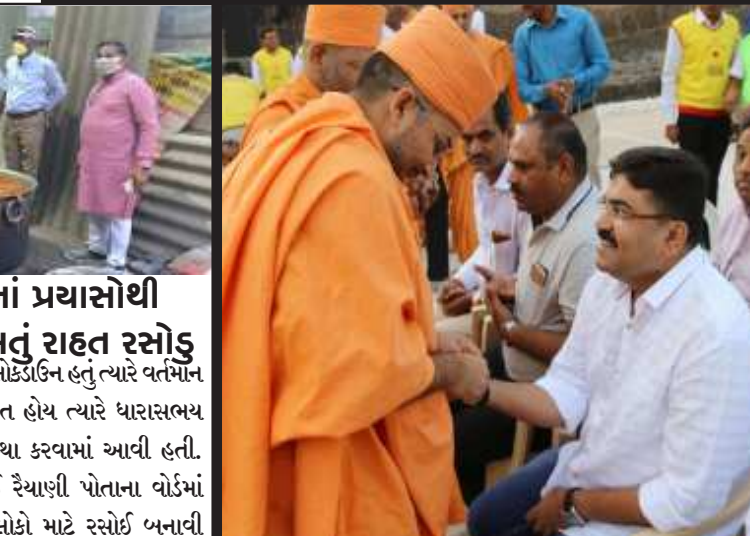
પૂ.સ્વામીના આશિર્વાદ લેતા રૈયાણી