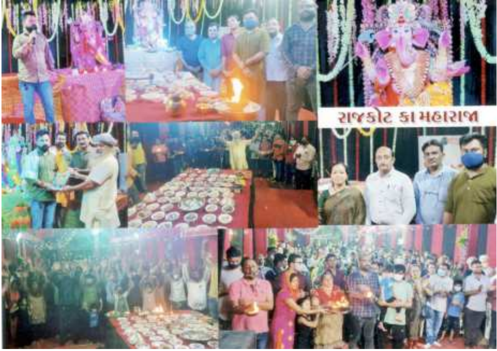
(સૌરાષ્ટ્ર ક્રાંતિ કાર્યાલય-રાજકોટ) રાજકોટ કા મહારાજા ગણેશ ભોગ અન્નકોટનું ભવ્ય આયોજન રાજકોટ, તા.૧૬ ઉત્સવમાં સાંજે ૬ થી ૮ વાગ્યે છપ્પન કરવામાં આવ્યું હતું.

રાજકોટ કા મહારાજા ને છપ્પન ભોગ અન્નકોટ ધરાયા શહેર ભાજપ કાર્યાલય બન્યું ગણપતિમય