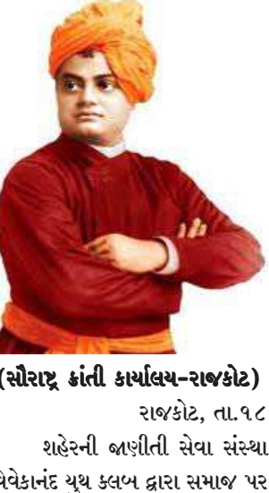
(સૌરાષ્ટ્ર કાંતી કાર્યાલય-રાજકોટ) રાજકોટ, તા.૧૮ શહેરની બાણીતી સેવા સંસ્થા વિવેકાનંદ યુથ ક્લબ દ્વારા સમાજ પર