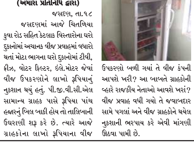
ઉપકરણો બળી ગયાં તે વીજ કંપની આપશે પરી? આ બાબતે ગ્રાહકોની બહાર રાજકીય નેતાઓ આવશે ખરાં? વીજ પ્રવાહ વધી ગયો તે જવાબદાર સામે પગલાં અને વીજ ગ્રાહકોને થયેલ નુકશાની ભરપાઈ કરે એવી માંગણી ઊઠવા પામી છે.

(અખારા પ્રતિનિધિ દ્વારા) જસદણ, તા.૧૮ જસદણમાં આજે ચિતગિયા કુવા રોડ સહિત કેટલાક વિસ્તારોના ઘરો દુકાનોમાં અચાનક વીજ પ્રવાહમાં વધારો થતાં મોટા ભાગના ઘરો દુકાનોમાં ટીવી, ફ્રીજ, વોટર ફિલ્ટર, ઈલે.મોટર જેવાં વીજ ઉપકરણોને લાખો રૂપિયાનું નુકશાન થયું હતું. પી.જી.વી.સી.એલ સામાન્ય ગ્રાહક પાસે રૂપિયા પાંચ હજારનું બિલ બાકી હોય તો તાલિયાની ઉધરાણી શરૂ કરે છે. ત્યારે આજે ગ્રાહકોના લાખો રૂપિયાના વીજ