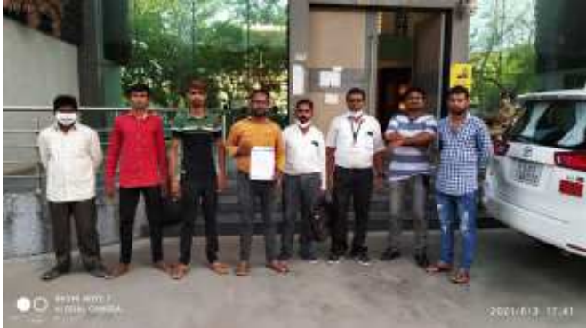
(સૌરાષ્ટ્ર કાંતી કાર્યાલય-રાજકોટ)

રાષ્ટ્રીય દલિત અધિકાર મંચ દ્વારા રાજકોટ કલેક્ટર મારફત રાજ્યપાલને આવેદનપત્ર પાઠવ્યું