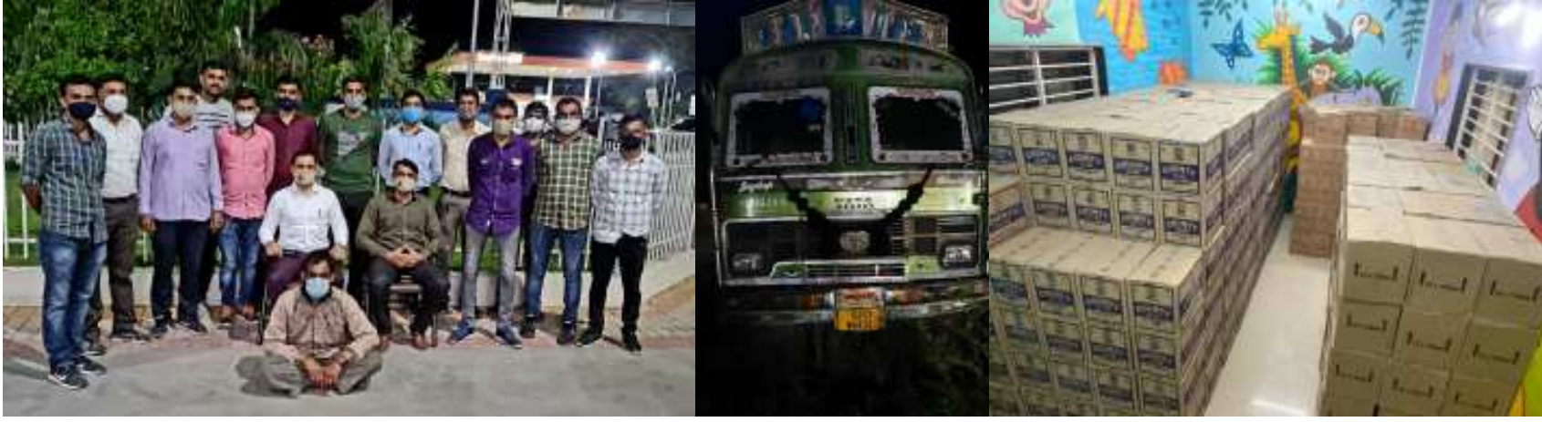
(સૌરાષ્ટ્ર ક્રાંતિ કાર્યાલય-રાજકોટ) રાજકોટ, તા. ૫ રાજકોટ ગ્રામ્ય વિસ્તારમાં દારૂનો વેપલો કરતા બુટલેગરો સક્રિય બન્યા હોવાથી દારૂની બંદિને નાબુદ કરવા ગઈકાલે પેટ્રોલિંગ દરમિયાન આટકોટના જંગલ ગામ પાસેથી રૂ. ૧૬.૨૩ લાખની કિંમતનો દારૂ ભરેલો ટ્રક સાથે માધવપુરા શાખાને દબોચી લઈ કુલ

ફૂલ એલ.સીબીની ટીમે ચોકકસ બાતમીના આધારે વોચ ગોઠવી દારૂના જથ્થા સામે માધવપુરા શાખાની ધરપકડ કરી કુલ રૂ.૨૬.૩૦ લાખનો મુદ્દામાલ કબ્જે કર્યો