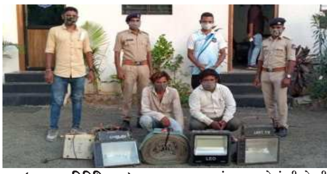
(અમારા પ્રતિનિધિ દ્વારા) ભરૂચ, તા.૫

રૂ. ૩૬,૨૦૦ નો ચોરીનો મુદ્દામાલ કબજે કરી કાર્યવાહી કરાઈ