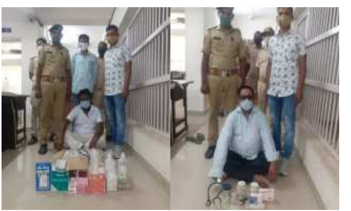
(અમારા પ્રતિનિધિ દ્વારા) ભરૂચ, તા.૫