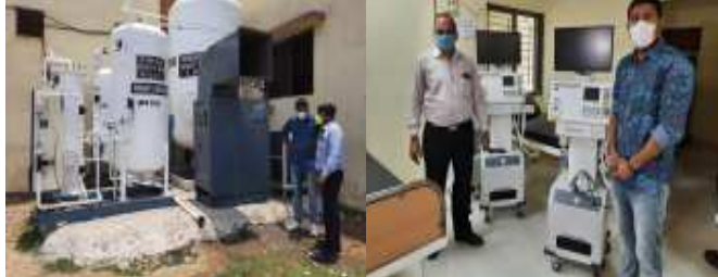
(અમારા પ્રતિનિધિ દ્વારા) અંકલેવર, તા.૫

રાજ્યના સહકાર મંત્રી ઈન્વેસ્ટિંગ પટેલ દ્વારા ૬ બાયપેક તેમજ તેમની ગ્રાન્ટ માંથી અન્ય મેડિકલ સાધનો ઉપલબ્ધ કરાવ્યા છે. તેમજ કોરોના ના સંભવિત ત્રીભ તબક્કાને ધ્યાને લઈ દહેજની ભારત રસાયણ કંપની દ્વારા ઓક્સિજન પ્લાન્ટ ઉભો કરી તેને કાર્યરત કરવામાં આવ્યો છે આ ઓક્સિજન પ્લાન્ટ થકી દિવસ દરમ્યાન ૨૫ જેટલા જમ્મો ઓક્સિજન પોટલો પ્રોવાઈડ કરે તેવી ક્ષમતા ધરાવે છે સાથે ગુજરાત કેમિકલ પોર્ટ કંપની દ્વારા આ સીએચસી સેન્ટર ને બે વેન્ટિલેટરની ભેટ આપવામાં આવતા આ સામુહિક આરોગ્ય કેન્દ્ર કોરોનાના સંભવિત ત્રીભ તબક્કાને પહોંચી વળવા સક્ષમ બન્યું છે. (૧૪.૧)