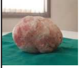
(અમારા પ્રતિનિધિ દ્વારા) ભરૂચ, તા.૫

૬૨ વર્ષના વૃદ્ધનું ૬૪૦ ગ્રામની પથરીનું સફળ ઓપરેશન