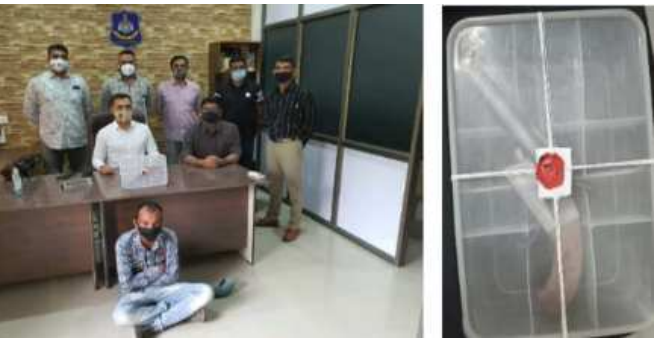
બનાવટનો કટ્ટો (હથિયાર) કિંમત રૂ.૫૦૦૦ નો મળી આવતા પોલીસે તેની ધરપકડ કરી રૂ.૫૦૦૦ ને દેશી બનાવટનો કટ્ટો કબજે કર્યો છે.