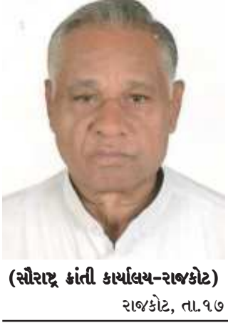
(સૌરાષ્ટ્ર ક્રાંતિ કાર્યાલય-રાજકોટ) રાજકોટ, તા.૧૭

કોરોના મહામારીથી લોકોની સુરક્ષા, કોવિડ સંક્રમિતોની સારવારમાં સ્ત્રીકરણ, દવા, ઈજેક્શન, ઓકિસજન, હોસ્પિટલમાં બેડની અછત નિવારવા તથા કોવિડ કેન્દ્રો ઉભા કરવામાં - ચલાવવામાં પ્રવર્તમાન ભા.જ.પ. સરકાર વામણી પૂરવાર થઈ રહેલ હોય, તે માટે સંસદ સભ્ય, ધારાસભ્યો તથા કોર્પોરેટરોએ તાજેતરમાં પોતાની ગ્રાન્ટના નાણાં ફંડમાં આપીને આર્થિક સહાય કરવાના પ્રસિધ્ધીના ઢોલ પીટાવ્યા છે. તે પારકા એટલે કે આમ જનતાના કરવેરાના નાણાંથી પીટાવ્યા છે. આમ જનતાના કમ્મરતોડ કરવેરાથી મેળવેલ નાણાં એ લોકોના સાર્વજનિક બહેર નાણાં છે. સંસદ સભ્ય, ધારાસભ્યો કે કોર્પોરેટરોના તે અંગત નાણાં નથી. જેનો ઉપયોગ