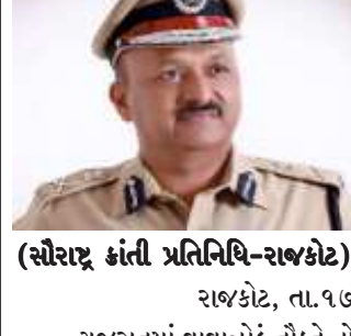
(સૌરાષ્ટ્ર ક્રાંતી પ્રતિનિધિ-રાજકોટ) રાજકોટ, તા.૧૭

કોઈ પોલીસ અધિકારી કે કર્મચારી અગામી ૪૮ કલાક પોતાના ઘરે નહીં જાય અને પ્રજાની સેવામાં રહેશે: પોલીસ કમિશનર