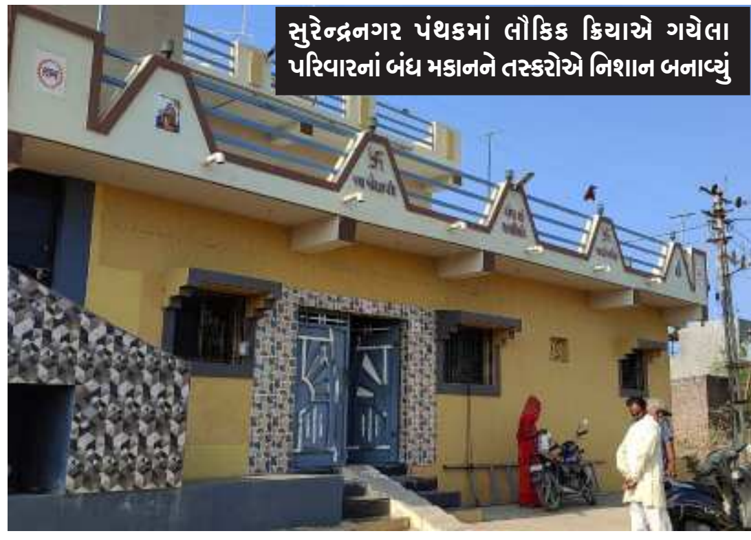
સુરેન્દ્રનગર પંથકમાં લોકિક ક્રિયાએ ગયેલા પરિવારનાં બંધ મકાનને તસ્કરોએ નિશાન બનાવ્યું